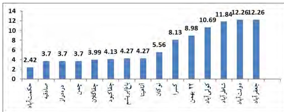
شکل ۲- نمودار توزیع پراکندگی مسائل اقتصادی به‌عنوان اولویت اول در محلات مختلف