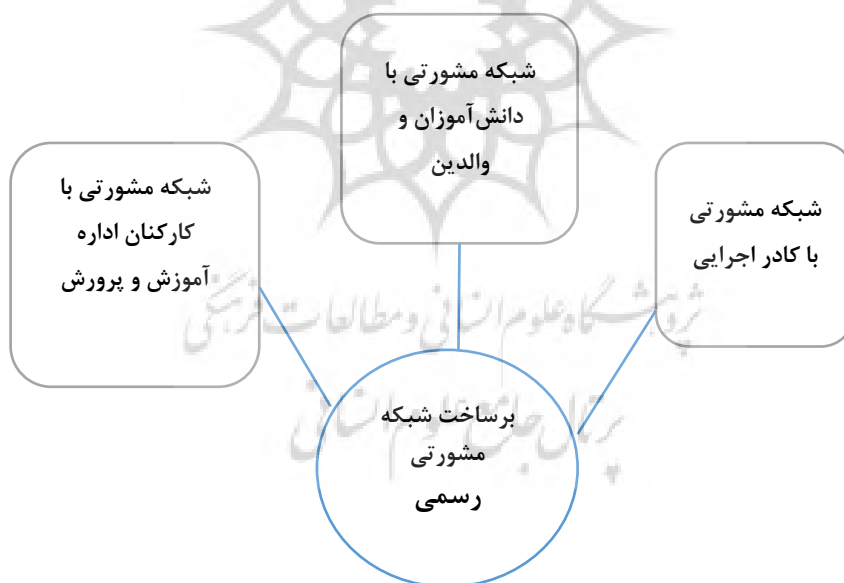
شکل ۱. شبکه مضامین برساخت شبکه مشورتی رسمی

یکی از دلایل تفاوت شبکه‌های فردی مدیران، تجربه زیسته و دانش عامه متفاوت آنان است. آقای مدیر ناحیه یک با ۲۰ سال سابقه مدیریت می‌گوید: «در بعضی از مسائل من معمولاً زنگ می‌زنم از کارشناسان اداره می‌پرسم». درحالی‌که خانم مدیر ناحیه دو با ۱۴ سال سابقه مدیریت می‌گوید: «با والدین مشورت می‌کنم و با کمک والدین راه‌حل مناسب برخی از مشکلات را انتخاب می‌کنم».