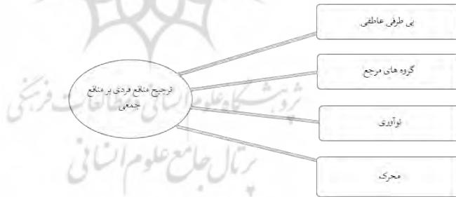
شکل ۱. مدل نظری تحقیق