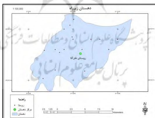
شکل ۲. موقعیت و پراکندگی روستاهای دهستان زیرراه (ترسیم‌کننده: نگارندگان)