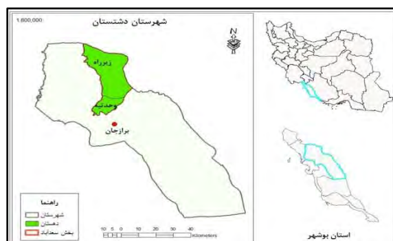
شکل ۱. نقشه موقعیت فضایی دهستان زیرراه (ترسیم‌کننده: نگارندگان)

بخش سعدآباد دارای ۲ شهر سعدآباد و وحدتیه، ۲۷ روستای مسکونی، دهها آبادی و ۲ دهستان بنام‌های وحدتیه و زیرراه می‌باشد (شکل ۱).