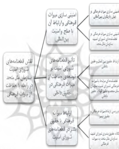
نمودار شماره (۱): نمودار پژوهش

سازمان ملل متحد در حفاظت از میراث فرهنگی کشورها تأثیرگذار بوده است؟ در پاسخ به پرسش مذکور، فرضیه این نوشته بدین مضمون است: اثرگذاری قطعنامه‌های شورای امنیت سازمان ملل متحد در حفاظت از میراث فرهنگی از طریق رویه‌های امنیتی‌سازی، ارتباط با جنبه حقوق بشری و ارتباط با حقوق داخلی کشورها بوده است. در مقام پاسخ به پرسش و فرضیه این پژوهش با رویکرد توصیفی - تحلیلی طبق نمودار شماره (۱) ابتدا امنیتی‌سازی میراث فرهنگی توسط شورای امنیت و سپس تأثیرگذاری قطعنامه‌های شورای امنیت بر حقوق داخلی کشورها و در خاتمه بررسی ارتباط میراث فرهنگی با حقوق بشر در قطعنامه‌های شورای امنیت مورد بحث و بررسی قرار خواهد گرفت.