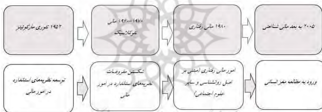
شکل (۲) سیر تاریخی رویکرد اقتصاد از کلاسیک تا اقتصاد شناختی در ارتباط با تصمیمات تحصیلی دانشجویان و شهریه

و همکاران ۱ (۲۰۱۷) و کپل ۲ (۲۰۱۹) اشاره کرد؛ (۲) نظریه انتخاب منطقی ۳ (بیکر ۴ ، ۱۹۷۶)؛ این نظریه توضیحی در باب نقش شهریه در تصمیمات تحصیلی دانشجویان در زمینه امور مالی فراهم می‌آورد تصمیمات مالی دانشجویان را به‌عنوان روشی برای تجزیه و تحلیل هزینه-فایده توضیح می‌دهد. از این منظر، با بالا رفتن هزینه‌های پولی و شخصی دانشگاه، مزایا باید به‌طور متناسب با آن با در نظر داشتن فرصت‌های بازار کار برای جذب افزایش یابد. هزینه‌های پولی با هزینه‌های مستقیم (مانند شهریه و کتاب) و هزینه‌های فرصت ازدست‌رفته تعیین می‌شوند (داوود، ۲۰۰۴). از جمله مطالعاتی که به نظریه انتخاب منطقی و شهریه پرداخته‌اند می‌توان به اسپینوزا و همکاران ۵ (۲۰۲۳)؛ وبر و برنز ۶ (۲۰۲۱)؛ کانن ۷ (۲۰۱۹) و هالباک ۸ (۲۰۱۷) اشاره کرد. (۳) نظریه اقتصاد شناختی؛ سیر تاریخی رویکرد اقتصاد از کلاسیک تا اقتصاد شناختی در ارتباط با تصمیمات (ساهی، ۲۰۱۲) در شکل (۲) آمده است.