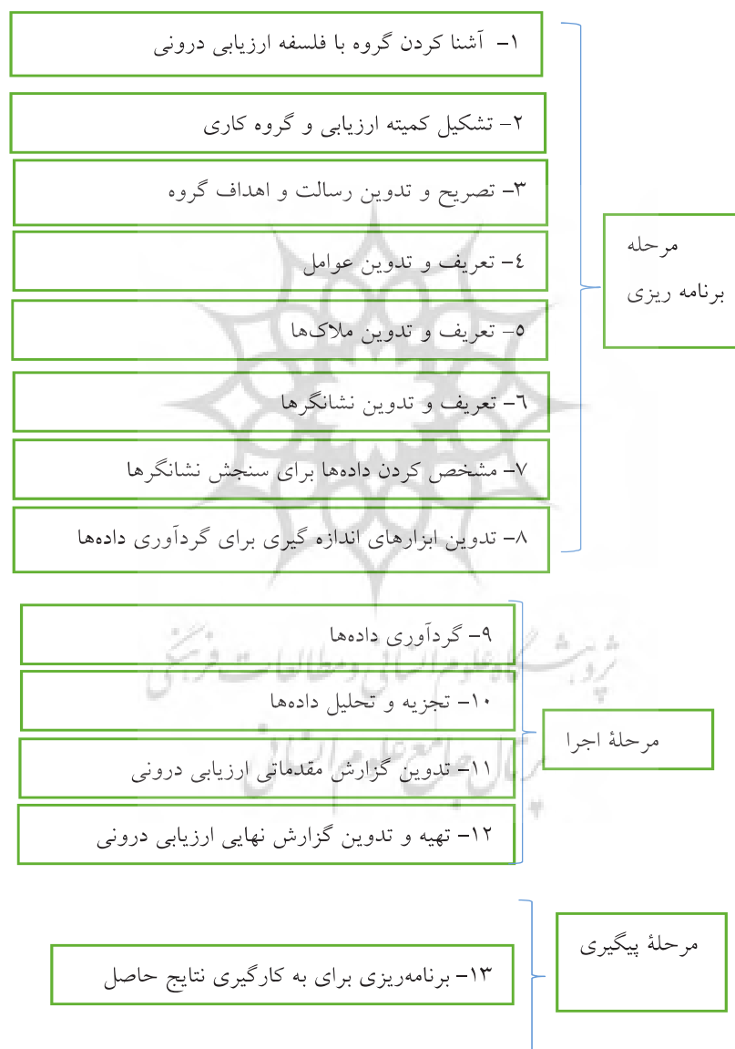
شکل ۲: نمودار الگوی ارزیابی درونی (۱۴۰۰)

عامل، ۴۲ ملاک و ۲۱۴ نشانگر تدوین و نهایی شد. سپس، در بخش کمی، پرسش‌نامه طراحی شده اجرا شد. بر این اساس پس از استخراج عوامل، ملاک‌ها و نشانگرهای مناسب، الگوی انجام ارزیابی درونی بر اساس دانش و تجربه‌های ملی در قالب سه سطح اصلی و ۱۲ گام احصاء شد. به عبارت بهتر الگوی موجود برای ارزیابی درونی ارائه شده توسط محمدی (۱۴۰۰) که در گروه‌های آموزشی تابع وزارت متبوع طراحی شده بود، برای انجام ارزیابی درونی مناسب و معتبر تشخیص داده شد. نتایج اجرا نشان داد: