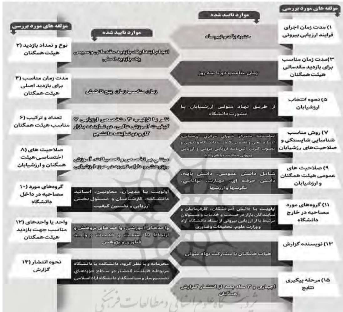
جدول ۱۰: چهارچوب احصا شده فرایند ارزیابی بیرونی در سطح گروه آموزشی در دانشگاه آزاد اسلامی

به طوری که در جدول (۳) مشاهده می شود ۳۸/۷ درصد از شرکت کنندگان زمان مناسب برای اجرای کل فرایند ارزیابی بیرونی توسط هیأت همگنان را یک ماه، ۴۶/۷ درصد دو ماه و ۱۴/۷ درصد سه ماه بیان کرده اند. بر این اساس در صورتی که گزارش ارزیابی درونی و مستندات پشتیبان آن آماده و قابلیت استفاده و کاربرد توسط هیأت همگنان را داشته باشد، می توان در زمانی حدود یک و نیم ماه، فرایند ارزیابی بیرونی را به نحو مناسب انجام داد.