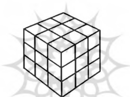
شکل ۲: ماتریس روبیکی (شش وجهی) ارزشیابی مراکز یادگیری محلی براساس الگوی سیپ

پژوهش حاضر با هدف شناسایی عوامل، ملاک‌ها، نشانگرها و ابزارهای قضاوت برای بررسی و ارزشیابی مراکز یادگیری محلی سازمان نهضت سوادآموزی بر اساس الگوی ارزشیابی سیپ انجام شد و بدین منظور از روش پدیدارشناسانه و ابزار مصاحبه استفاده شد. بررسی و تحلیل داده‌ها، بیانگر اهمیت چهار عامل اصلی در ابعاد چهارگانه ارزشیابی سیپ بود که ارزیابان برای بررسی مراکز یادگیری محلی و ارزشیابی فعالیت و روند آن با بررسی این عوامل به نتایج و ارزیابی جامعی دست یافتند. همچنین ارزشیابی دقیق و همه‌جانبه بر اساس ۲۸ ملاک، ۱۳۹ نشانگر، با استفاده از ابزارهای قضاوت به دست آمده. در بررسی ابعاد ارزشیابی سیپ برای هر عامل، ملاک و نشانگری که لازم بود بررسی و تبیین شد. نتایج به دست آمده از تحلیل داده‌ها و استخراج عوامل، ملاک‌ها و نشانگرها در قالب ماتریسی در شکل (۲) که مبین وجوه ارزشیابی مراکز یادگیری محلی با الگوی سیپ است، ترسیم شده است.