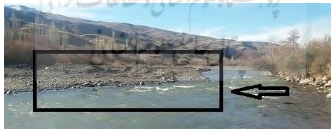
شکل (۵) برداشت شن و ماسه به صورت محلی در بازه ۴ Fig (5) Local sand removal

در بازه‌ی چهارم رودخانه نسبتاً محدود بوده و به صورت ناپیوسته دشت سیلابی در یک طرف وجود دارد و طرف دیگر به دامنه‌ی کوه متصل شده است. الگوی رودخانه سینوسی بوده، رسوبات بستر از ماسه ریز و درشت تشکیل شده است. اما این بازه از نظر تغییرات انسانی شدیداً تحت تأثیر می‌باشد. از جمله برداشت شن و ماسه (شکل ۵)، وجود سازه پل بر روی رودخانه، وجود منطقه‌ی مسکونی و تخریب پوشش گیاهی کناره‌ی رودخانه را می‌توان ذکر کرد. برای فرسایش کناره‌ی نیز با استفاده از مدل NBS نتایج نشان داد که فرسایش کناره‌ی در این بازه شدید است که در مشاهدات میدانی نیز این مورد مشهود بود. که وجود دخالت‌های انسانی بالا در این مقطع موجب شده که مقدار MQI به دست آمده برای این مقطع ۰/۴۸۷ باشد و در طبقه ضعیف قرار بگیرد.