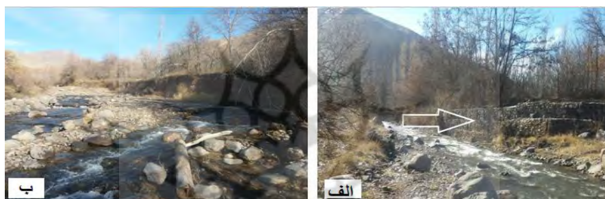
شکل (۳) الف) سنگچینی دیواره و گابیون‌بندی ب) واریزه‌های چوبی، رسوبات گراولی و قطعه سنگی بستر در بازه‌ی ۲

میزان فرسایش کناره در این بازه بر اساس مدل NBS کم می‌باشد، همچنین شیب بستر کانال به صورت میانگین در این بازه ۰/۰۲۴ است. این بازه دارای الگوی نک کانالی با سینوسیته کم است و واحدهای ژئومورفولوژی آن شامل اشکال درون کانالی و اشکال طولی در حاشیه کانال اشد (شکل ۳). در مجموع میزان MQI در این بازه ۰/۵۸۴ بوده که در طبقه متوسط قرار می‌گیرد.