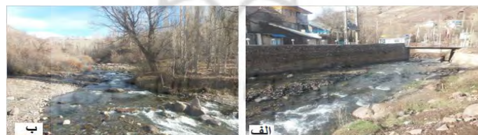
شکل (۲) الف) دیوار چینی و ساخت پل ب) بستر گراولی و دست‌نخورده در بازه ۱ Fig (2) a) A rip rap and bridge construction b) undisturbed and gravel bed in the first reach

این بازه در ناحیه‌ی کوهستانی و بالادست رودخانه قرار گرفته که از هر دو طرف به دره وصل شده و محدود است. براساس مدل NBS دارای فرسایش کناره‌ای خیلی کم بوده و متوسط شیب بستر در این بازه ۰/۰۲۸ است. این بازه دارای بستر گراولی می‌باشد (شکل ۲). عرض کانال از ۱۰ تا ۱۸ متر متغیر بوده و دارای الگوی تک‌کانالی است. حدود ۲۰٪ از این بازه تحت تأثیر دخالت‌های انسانی بوده که شامل پل، دیوارچینی کانال رود می‌باشد (شکل ۲). اما با توجه به اینکه ۸۰٪ بقیه‌ی بازه دست‌نخورده بوده و حالت طبیعی دارد، میزان MQI به دست آمده در این بازه ۰/۷۱۴ بود که در طبقه خوب قرار می‌گیرد.