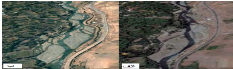
شکل (۴) الف تصویر ماهواره‌ای سال ۲۰۱۷ ب) تصویر ماهواره‌ای سال ۲۰۰۷ در بازه‌ی ۳ Fig (4) a) Google earth image in 2017 b) Google earth image in 2007 in third reach

در بازه‌ی چهارم رودخانه نسبتاً محدود بوده و به صورت ناپیوسته دشت سیلابی در یک طرف وجود دارد و طرف دیگر به دامنه‌ی کوه متصل شده است. الگوی رودخانه سینوسی بوده، رسوبات بستر از ماسه ریز و درشت تشکیل شده است. اما این بازه از نظر تغییرات انسانی شدیداً تحت تأثیر می‌باشد. از جمله برداشت شن و ماسه (شکل ۵)، وجود سازه پل بر روی رودخانه، وجود منطقه‌ی مسکونی و تخریب پوشش گیاهی کناره‌ی رودخانه را می‌توان ذکر کرد. برای فرسایش کناره‌ی نیز با استفاده از مدل NBS نتایج نشان داد که فرسایش کناره‌ی در این بازه شدید است که در مشاهدات میدانی نیز این مورد مشهود بود. که وجود دخالت‌های انسانی بالا در این مقطع موجب شده که مقدار MQI به دست آمده برای این مقطع ۰/۴۸۷ باشد و در طبقه ضعیف قرار بگیرد.