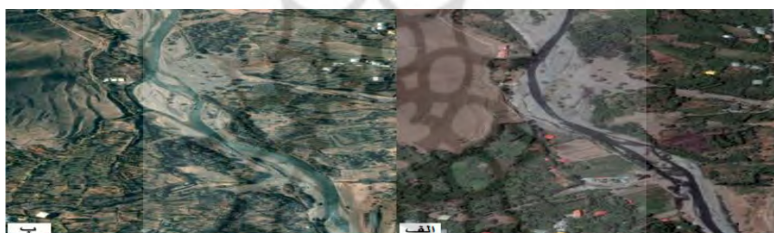
شکل (۶) الف) تصویر ماهواره‌ای در سال ۲۰۱۷ ب) تصویر ماهواره‌ای در سال ۲۰۰۷ از بازه‌ی ۵ Fig (6) a) Google earth image in 2017 b) Google earth image in 2007 in six th reach

هر دو طرف به دشت سیلابی متصل می‌شود. بر اساس تصاویر ماهواره‌ای در طول ۱۰ سال از سال ۲۰۰۷ تا ۲۰۱۷ مسیر کانال تغییر یافته است (شکل ۶). شیب بستر به طور میانگین حدود ۰/۰۱۷ متر بر متر و طول بازه و رسوبات بستر نیز از ماسه و گراول تشکیل شده است. عرض کانال از ۲۵ تا ۳۵ متر متغیر است فرسایش کناره‌ای در این بازه براساس مدل NBS خیلی زیاد است. از نظر تغییرات انسانی در این بازه برداشت شن و ماسه به صورت محلی وجود دارد و سازه‌های کنار این بازه شامل جاده و پل می‌شود و در مجموع میزان MQI برای این بازه ۰/۵۸۵ می‌باشد که در طبقه متوسط قرار می‌گیرد.