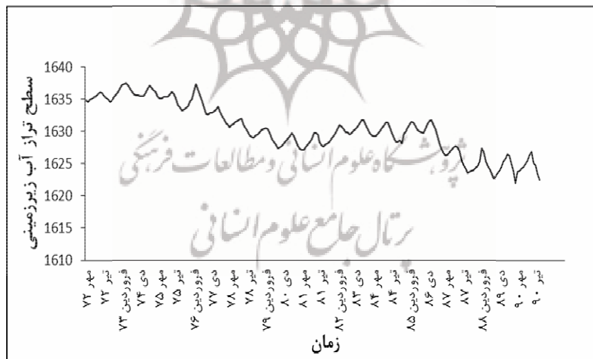
شکل (۳) هیدروگراف واحد دشت تویسرکان

با توجه به شکل (۳) میزان افت کل در دوره‌ی آماری برابر با ۱۲/۳۳ متر و متوسط افت سالیانه برابر با ۰/۶۵ متر می‌باشد. با احتساب محدوده‌ی آبخوان اصلی (۱۵۰ کیلومتر مربع) و میزان متوسط افت سالیانه (۰/۶۵ متر) و ضریب ذخیره‌ی ۶ درصدی میزان کسری حجم مخزن در طول دوره‌ی آماری (۱۹ ساله) برابر با ۱۱۰/۹۷ میلیون مترمکعب است. متوسط کسری حجم مخزن سالانه در این دشت برابر با ۵/۸۴ میلیون مترمکعب برآورد می‌گردد. بر اساس هیدروگراف واحد مشخص است سطح آب زیرزمینی در سال‌های ۱۳۸۷-۱۳۹۰ به شدت کاهش یافته است. روند افزایشی افت سطح آب زیرزمینی در هیدروگراف بیانگر آن است که اثرات برداشت از آب زیرزمینی در سال‌های آبی بعدی جبران نشده و در اثر خشکسالی و برداشت بی‌رویه توسط چاه‌های کشاورزی، حجم مخزن هر ساله کاهش یافته است.