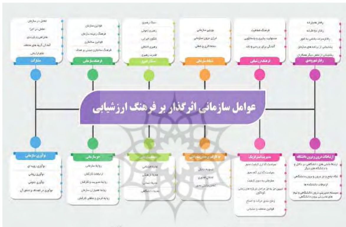
شکل ۳: نمایی از ملاک‌ها و نشانگرهای فرهنگ کیفیت در بُعد سازمانی

بر اساس نتایج حاصل از جدول (۵) می‌توان ملاک‌هایی نظیر مدیریت و رهبری، نشاط سازمانی، فرهنگ سازمانی، ارتباطات درون دانشگاهی، ارتباطات برون دانشگاهی، رفتار شهروندی، مدیریت راهبردی، محیط سازمانی، نوآوری سازمانی و فرهنگ ارزشیابی را به عنوان مهم‌ترین ملاک‌های مرتبط با فرهنگ کیفیت در سطح دانشگاهی، شناسایی و دسته‌بندی کرد.