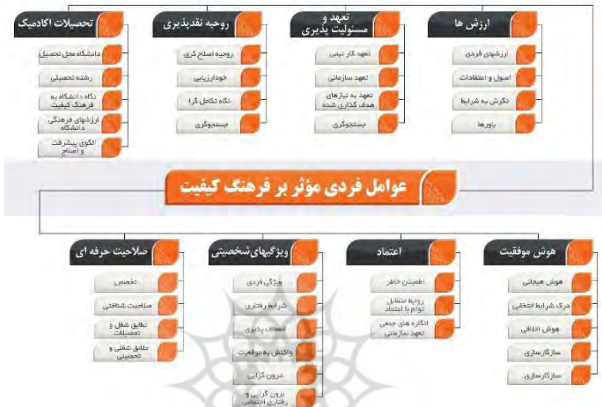
شکل ۲: نمایی از ملاک‌ها و نشانگرهای فرهنگ کیفیت در بُعد فردی

بررسی تحلیلی زمینه تکرارپذیری ملاک‌ها و نشانگرهای فردی مرتبط با فرهنگ کیفیت، نشان داد که ویژگی‌های شخصیتی، روحیه نقدپذیری و صلاحیت‌های تخصصی و فردی در بین مقوله‌های مرتبط به فرهنگ کیفیت، بیشترین تکرارپذیری را دارد و در بین نشانگرهای مطرح و مربوط به هر ملاک، در مجموع روحیه نقادی و جستجوگری، انعطاف شخصیتی، صلاحیت‌های شناختی، خودارزیایی، روحیه اصلاح‌گری، نگاه دانشگاه تحصیل به مسئله کیفیت بخشی، علایق شغلی و تحصیلی، ارزش‌های فردی، هوش هیجانی و اصول و اعتقادات ده نشانگر اصلی مورد تأکید، بر حسب بیشترین تکرارپذیری بر فرهنگ کیفیت در بُعد فردی است.