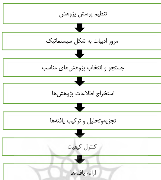
نمودار (۱) فرایند فراترکیب (بارسو و ساندوسکی، ۲۰۰۷)

برای این منظور، پژوهش‌های منتشرشده در خصوص توسعه حرفه‌ای اعضای هیئت علمی که متن کامل آنها در پایگاه‌های اطلاعاتی علم‌نت، مگیران، نورمگز، سیولیکا، اس‌آی‌دی، گوگل اسکالر، ۲ ساینس دایرکت، ۳ سیج، ۴ اریک، ۵ جی‌استور ۱ آی‌ای‌ای، ۶ اسکوپوس، ۷ پروکوئست، ۸ اسپرینگر ۹ و الزویر ۱۰ قابل دسترس بود (جمعا به تعداد ۱۹۰۴۸۶) به‌عنوان جامعه آماری انتخاب شدند. بر اساس نظر بوندز و هال ۱۱ (۲۰۰۷)