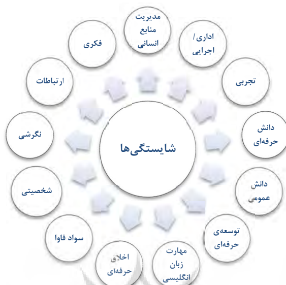
شکل (۱) الگوی ابعاد شایستگی‌های دانش‌آموختگان رشته مدیریت آموزشی (برگرفته از بخش کیفی پژوهش)

در ادامه پاسخ به پرسش اول، برای برآزش الگوی شایستگی‌های دانش‌آموختگان رشته مدیریت آموزشی جهت اشتغال در واحد آموزش سازمان‌های صنعتی، از تحلیل عاملی تأییدی مرتبه اول با استفاده از ابعاد سبزه‌گانه شایستگی‌های دانش‌آموختگان بهره گرفته شد. در این تحلیل، در پی پاسخ به این پرسش بودیم که آیا متغیر اصلی پژوهش به‌درستی توسط عوامل فرعی (ابعاد) سنجیده می‌شود؟ که نتایج آن در شکل (۲) و جدول‌های (۵ و ۶) گزارش شده است.