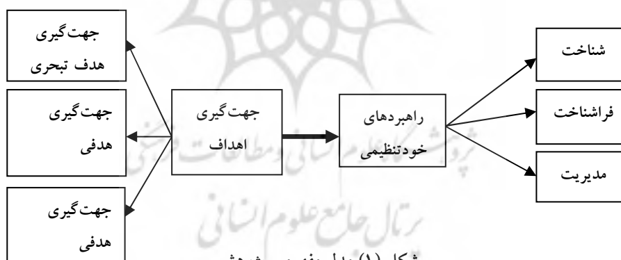
شکل (۱) مدل مفهومی پژوهش

بعد از بررسی مبانی نظری و پیشینه پژوهش، لازم است مدل مفهومی طراحی شود. هر مدل مفهومی به‌عنوان مبنایی برای انجام دادن مطالعات و تحقیقات است، به‌گونه‌ای که متغیرهای مورد نظر پژوهش و روابط میان آنها را مشخص می‌کند. بر همین اساس، مدل مفهومی مورد نظر را می‌توان در شکل (۱) مشاهده کرد.