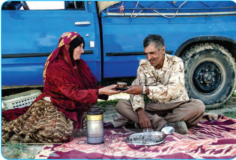
استان فارس، مرودشت، عشایر قشقایی