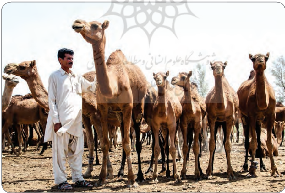
جنوب کرمان، مناطق عشایری قلعه گنج