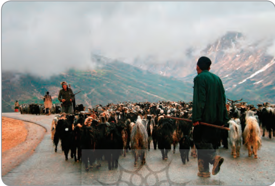
استان چهارمحال و بختیاری، بازفت، عشایر بختیاری