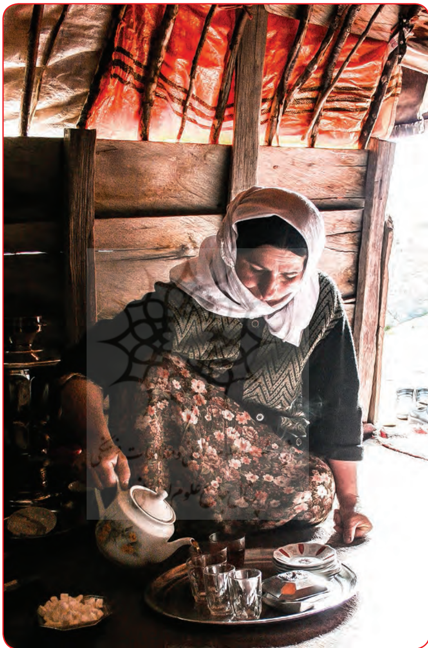
استان گیلان، عشایر تالش ▶