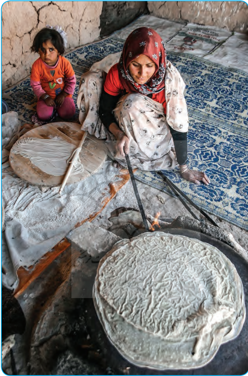
استان کهگیلویه و بویراحمد، عشایر گچساران