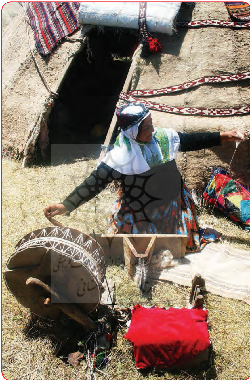
استان اردبیل، دشت مغان، عشایر شاهسون