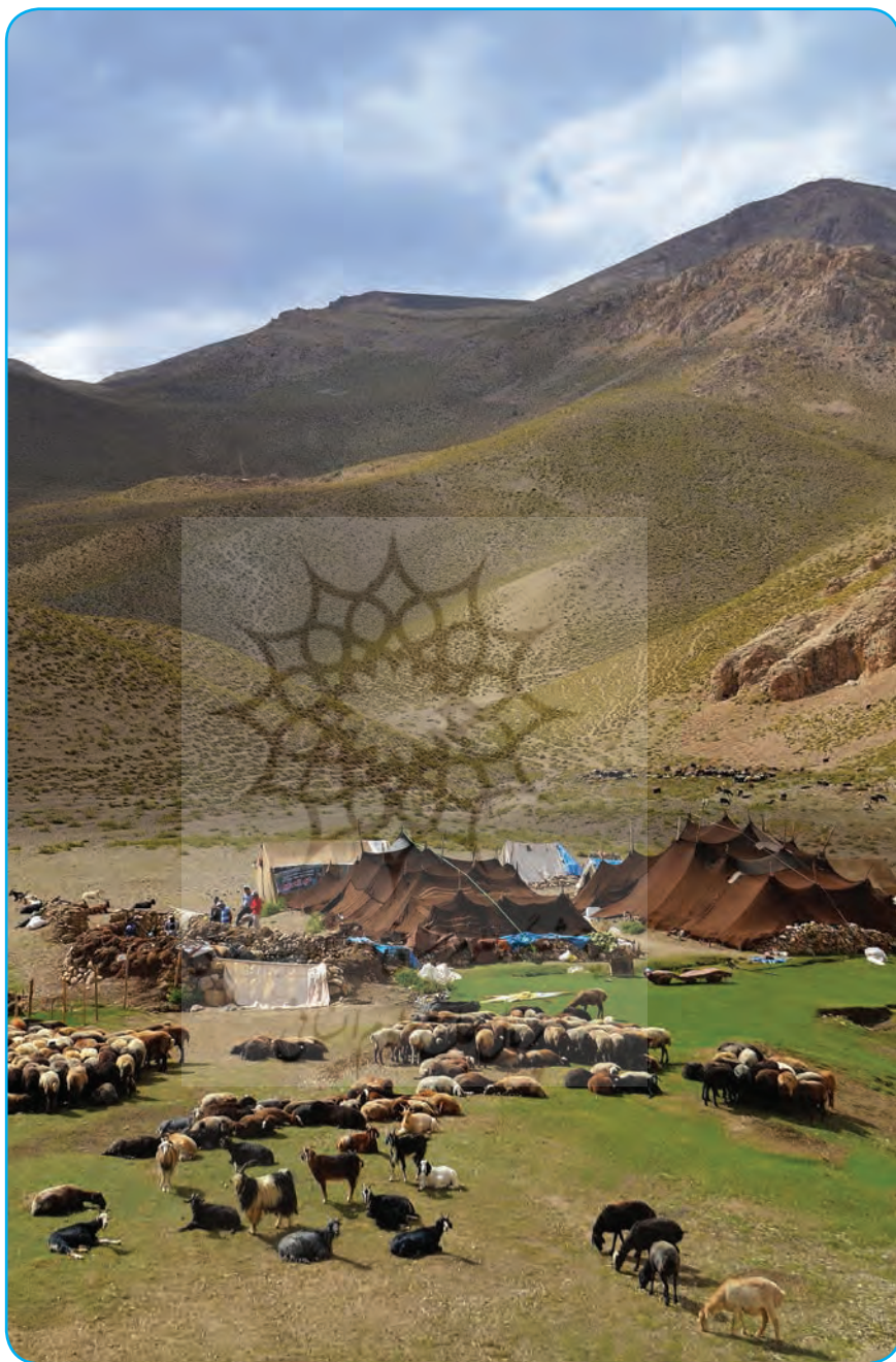
استان تهران، فیروزکوه ▶