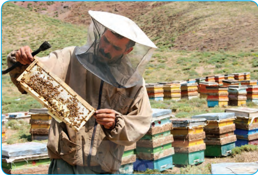
استان اردبیل، دشت مغان، عشایر شاهسون