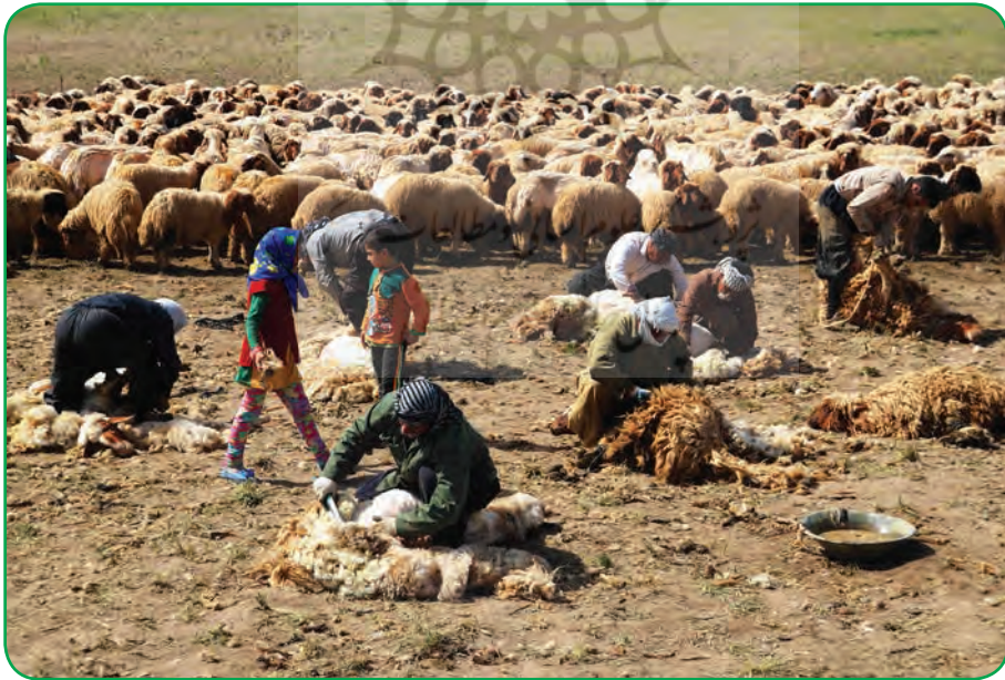
استان کرمانشاه، منطقه ییلاقی گراوند، عشایر زوله