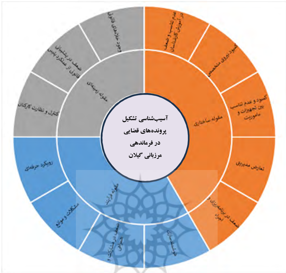
شکل شماره ۲: نمودار مدل نهایی پژوهش