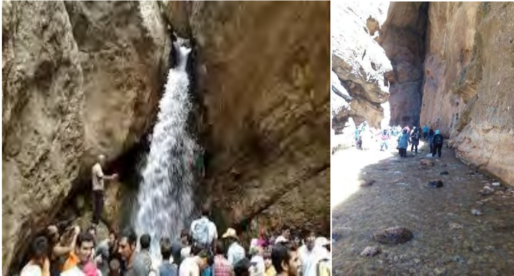
شکل ۴- تصاویر روددره گردشگری تنگه واشی.

آب و هوای مناسب این محور در تابستان‌ها، باعث جذب جمعیت کثیری از گردشگران است. تنگه واشی به طول حدود ۳۰۰ متر و با دیواره‌های صخره‌ای بلند به ارتفاع حدود ۱۰۰ متر محل عبور رودخانه‌ای است که از کوه‌های ساواشی سرچشمه می‌گیرد. یکی از مهم‌ترین جذابیت‌های این محور، عبور کل مسیر از میان آب است. فاصله ۱۰۰ کیلومتری این محور گردشگری با شرق شهر تهران می‌تواند از عوامل استقبال برای گردش باشد (دارابی، ۱۳۹۲).