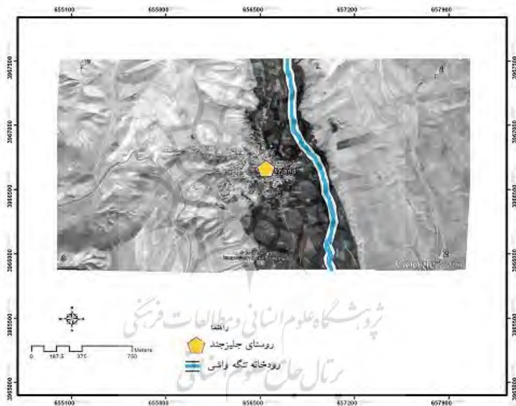
شکل ۳- نقشه موقعیت روستای جلیزجند نسبت به رودخانه تنگه واشی.

ارتفاع روستای جلیزجند ۲۵۵۵ متر از سطح دریا قرار گرفته است که در حدود ۱۵ کیلومتری شمال غربی شهرستان فیروزکوه قرار دارد و در مقیاس ناحیه‌ای به طور مستقیم با شهر فیروزکوه در تعامل فضایی است (دارابی، ۱۳۹۲).