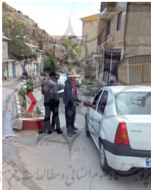
شکل ۵- محل اخذ عوارض ورود گردشگران به روستا.

در عین حال این نهاد از اختیارات محدودی برخوردار بوده اما به‌طور کلی خدمات عمومی روستا توسط دهیاری رتق و فتق می‌گردد. مسائل مربوط به صدور پروانه و مجوزهای ساخت و ساز و تغییرات در بستر زمین در داخل محدوده قانونی روستا برعهده بنیاد مسکن و در خارج از آن برعهده بخشداری می‌باشد، بنابراین یکی از مهم‌ترین نهادهای تصمیم‌ساز در روستا شورا است. در زمان توزیع پرسش‌نامه‌های پژوهش در روستای جلیزجند، مشاهده گردید یک شرکت تحت نظر دهیاری شکل گرفته و اقدام به دریافت عوارض از گردشگران می‌کند که از جنبه‌هایی دارای معایب و محاسن است از اینک تا چه حد بر مبلغ به‌دست آمده نظارت می‌شود زیرا اهالی روستا خواهان ظهور عینی آثار این سرمایه‌بر بهبود کالبد روستا بوده و همچنین تعیین میزان مبلغ دریافتی این عوارض از گردشگران که رضایت میهمان و میزبان را رعایت کند و در خدمات‌رسانی (به‌ویژه خدمات بهداشتی) به گردشگران نمود داشته‌باشد ملموس نیست. اما از محاسن طرح اینک، درآمد حاصله از این عمل در ایجاد اشتغال جوانان روستا تا اندازه‌ای (در فصول بهار و تابستان) مؤثر است و قانون‌مندی نسبی بر رفت و آمد گردشگران به وجود آورده‌است. تصویر دریافت عوارض عبور از روستای جلیزجند برای رسیدن به روددره تنگه واشی: