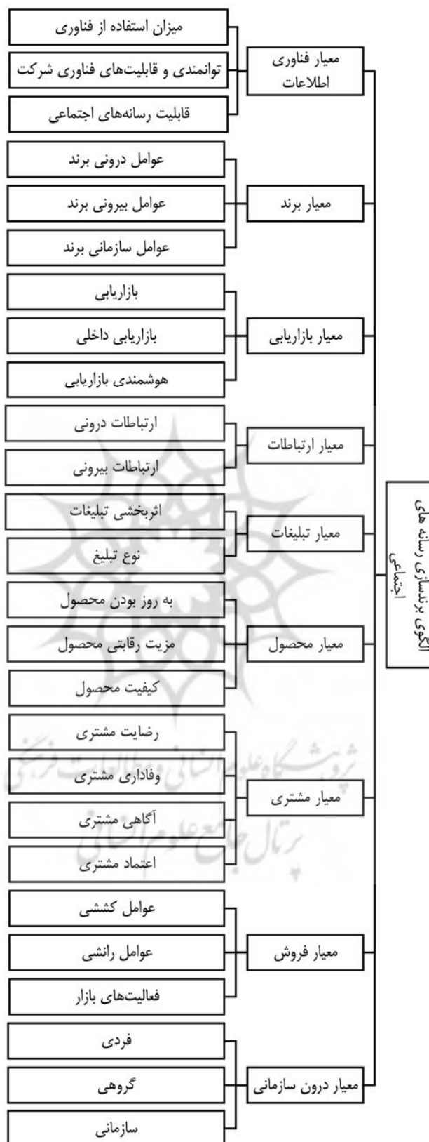
شکل ۱. الگوی به‌دست آمده از پژوهش