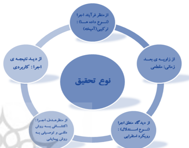
شکل ۱. نوع روش پژوهش

در پژوهش حاضر از استراتژی تجربی و پیمایشی برای تحلیل داده‌ها و رسیدن به نتایج پژوهش استفاده شد. پژوهشگر در این پژوهش از حیث توسل به کمی‌سازی رفتار پدیده مورد نظر، می‌تواند هر یک از روش‌های کمی، کیفی یا ترکیبی را اتخاذ نماید. در پژوهش کنونی از روش پژوهش ترکیبی (کیفی و کمی) استفاده شد. پژوهشگر بسته به اینکه در لایه‌های بالاتر پژوهش از چه رویکرد، استراتژی و روشی را به کار گرفته باشد از شیوه‌های مختلفی برای گردآوری و تجزیه و تحلیل داده‌های پژوهش استفاده می‌کند. مصاحبه، مشاهده، پرسش‌نامه و ... از جمله شیوه‌هایی است که برای گردآوری داده‌ها ممکن است مورد استفاده قرار گیرد. البته در برخی از پژوهش‌ها ممکن است به طور همزمان از چند شیوه برای گردآوری داده‌ها استفاده شود. در این پژوهش پژوهشگر با استفاده از ابزارهای کیفی مانند مصاحبه نیمه ساختار یافته به گردآوری داده‌های مورد نیاز و مفید پرداخت. با توجه به روش مورد استفاد تحلیل داده‌ها بر اساس مدل‌سازی ساختاری تفسیری (ISM) به دست آمده از مصاحبه‌ها انجام شد. مصاحبه تا آنجایی ادامه یافت که پژوهشگر قانع شد که در راستای پژوهش مطالب جدید مطرح نخواهد شد و پژوهش به اشباع نظری رسید.