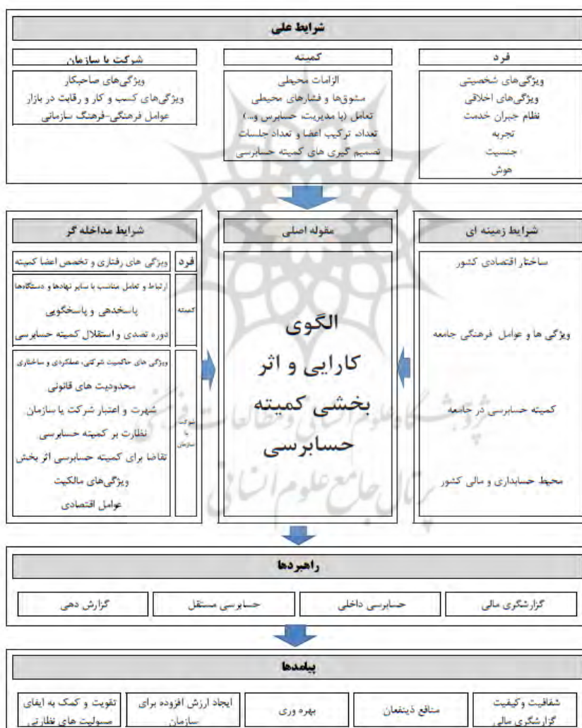
شکل ۱. الگوی ارتقاء کارایی و اثربخشی کمیته حسابرسی (علی حسینی، بشکوه و کردستانی، ۱۴۰۱)

حسابرسی از جمله مشغله‌های اعضا (شارما و ایسلین ۱ ، ۲۰۱۲؛ تانی و اسمیت ۲ ، ۲۰۱۵)، تداخل مسئولیت‌های متعدد اعضا (براندز و همکاران ۳ ، ۲۰۱۶؛ خاندکار و همکاران ۴ ، ۲۰۱۶)، دوره تصدی (دالی‌وال و همکاران ۵ ، ۲۰۱۰؛ چان و همکاران ۶ ، ۲۰۱۳) و جنسیت (آدامز و فریرا ۷ ، ۲۰۰۹؛ گل و همکاران ۸ ، ۲۰۱۱)، و در نهایت اندازه و میزان فعالیت کمیته (الوود و گارسیا - لاکاله ۹ ، ۲۰۱۶؛ جبرایل و همکاران ۱۰ ، ۲۰۱۸) را در بر می‌گیرد. افزون بر این رابطه بین ویژگی‌های قابل اندازه‌گیری کمیته حسابرسی و اثربخشی حاکمیت شرکتی از طریق سه نتیجه اساسی فرآیند گزارشگری شامل کیفیت حسابرسی داخلی، کیفیت حسابرسی مستقل، و کیفیت اطلاعات مالی، مورد توجه قرار گرفته است (کارسلو و همکاران، ۲۰۱۱؛ غفران و اُسالیوان ۱۱ ، ۲۰۱۳).