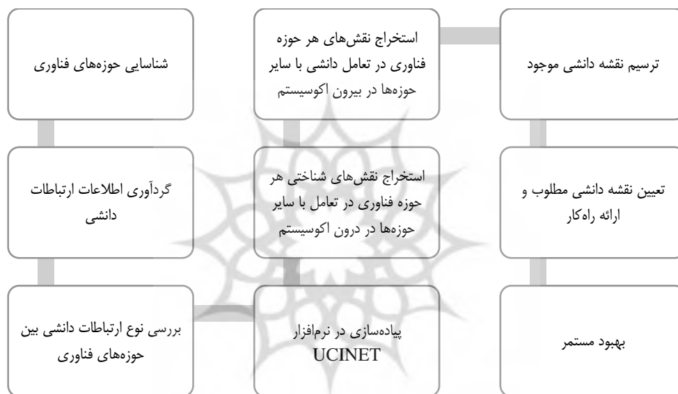
شکل ۱. مراحل اجرای پژوهش

اولین اقدام در راستای جمع‌آوری اطلاعات در این تحقیق، شناسایی و دسته‌بندی حوزه‌های فناوری و تخصیص استارت‌آپ‌ها و شرکت‌های سرمایه‌گذار، به تفکیک هر حوزه فناوری بوده است. در این خصوص شکل زیر مراحل فرایند تجزیه و تحلیل داده‌ها را نشان می‌دهد: