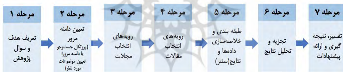
شکل ۲. مراحل مرور نظام‌مند ادبیات

به‌طور کلی مراحل انجام مرور ادبیات عبارت است از: طراحی مرور، انجام مرور، تحلیل و نوشتن نتیجه و جمع‌بندی مرور (اسنایدر، ۲۰۱۹). برای انجام پژوهش حاضر، از مدل شش مرحله‌ای آگوینیس، رامانی و عبد الجادر ۴ (۲۰۱۸، ۲۰۲۳)، مدل شش (ساور و سیورینگ ۵ ، ۲۰۲۳) و چارچوب PSALSAR ۶ استفاده شده است. مراحل پژوهش در شکل ۲ مشاهده می‌شود (آگوینیس و همکاران، ۲۰۲۳؛ پل و همکاران، ۲۰۲۳؛ ساور و سیورینگ، ۲۰۲۳).