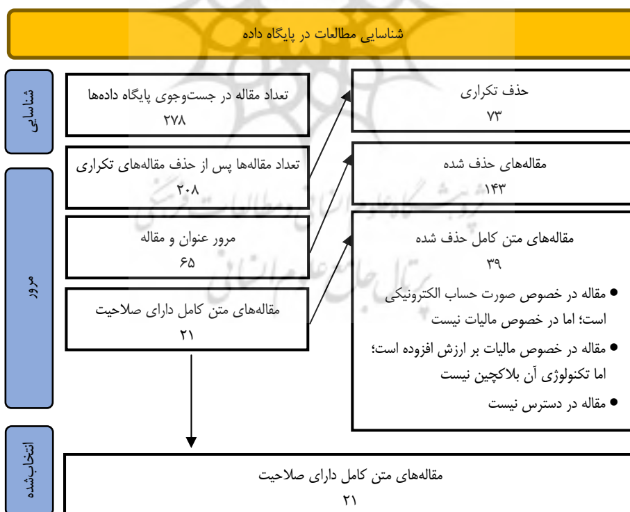
شکل ۱. نمودار جریان پریزما