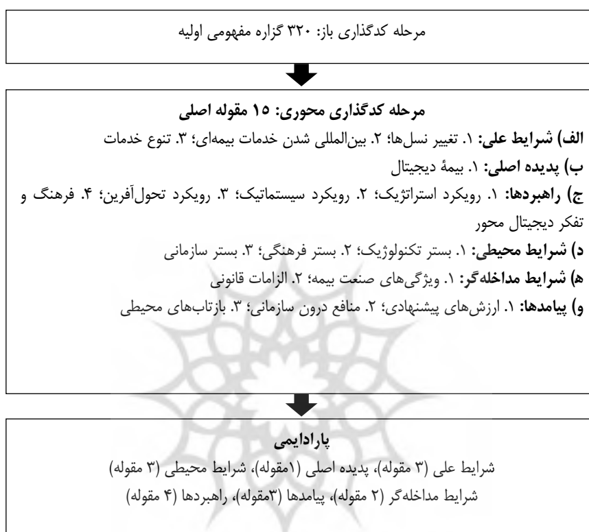
شکل ۱. فرایند مدیریت داده‌ها در مراحل کدگذاری

مطابق نظر اشتراوس و کوربین (۱۳۹۳) راهبردها اعمال، تعامل‌ها و کنش‌های افرادی هستند که در طرز عمل عادی و چگونگی مدیریت موقعیت‌ها در مواجهه با مسائل به کار برده می‌شوند. براساس مدل پارادایمی نظریه داده‌بنیاد، راهبردها، رفتارها و تعامل‌هایی هستند که تحت تأثیر شرایط مداخله‌گر و محیطی حاصل می‌شوند. با تحلیل مصاحبه‌های انجام‌گرفته در پژوهش، راهبردهای بیمه دیجیتال مطرح شد.