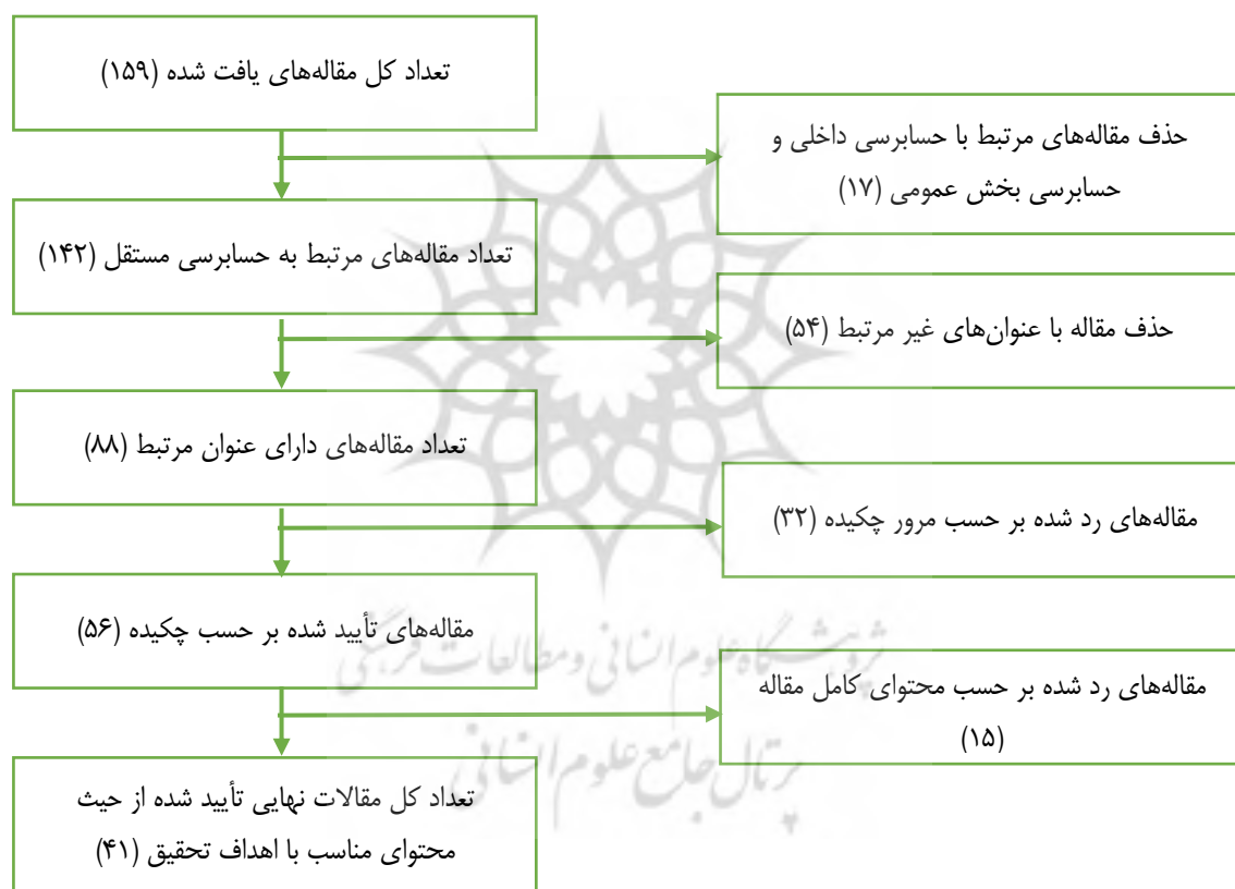
شکل ۲. الگوریتم انتخاب مقالات نهایی

پس از جست‌وجو، ابتدا یک غربالگری اولیه بر روی مطالعات یافت شده انجام شد. با توجه به اینکه کلیدواژگان جست‌وجو شده عمومی و پرتکرار هستند، پژوهش‌هایی یافت شد که هیچ مناسبت موضوعی با اهداف پژوهش نداشتند. برای مثال، برخی از پژوهش‌ها به بررسی ادبیات و جنبه‌های پژوهشی آتی ۱ مرتبط به یک موضوع حسابرسی (مثلاً کمیته حسابرسی یا حق الزحمه) پرداخته بودند یا به‌عنوان مثال دیگر، پژوهش‌های زیادی یافت شدند که به موضوع تغییر حسابرس ۲ ، یعنی تعویض حسابرس یا چرخش یا جایگزینی وی یا چرخش شریک کار و نظایر آن پرداختند. این قبیل پژوهش‌ها، به‌دلیل کلیدواژگان جست‌وجو شده ایجاد شده و لذا غربال اولیه برای حذف این گونه مقالات لازم است. پس از غربال اولیه، با توجه به معیارهای پذیرش جدول فوق، ۱۵۹ مقاله یافت شد. شکل ۲، الگوریتم انتخاب مقالات نهایی را نشان می‌دهد: