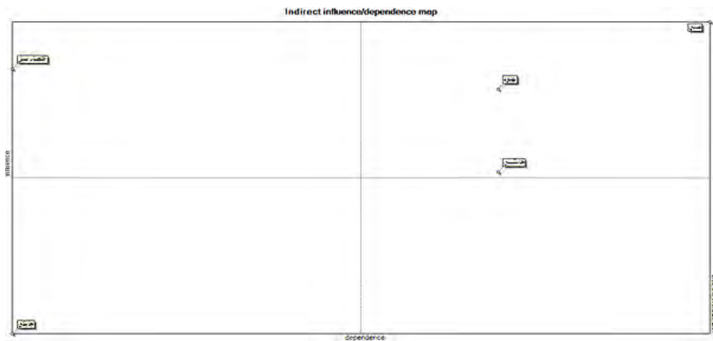
شکل ۳. نقشه اثر وابستگی غیر مستقیم

در شکل ۴ ارتباط بین شاخص‌ها در سطح پوشش ۱۰۰ درصد نمایش داده شده است که تنها روابط مستقیم بین متغیرها را که در ماتریس دلفی خبرگان، تاثیر زیاد (خطوط قرمز)، متوسط، کم، خیلی کم (خطوط نقطه چین) به آنها تعلق گرفته است به نمایش می‌گذارد.