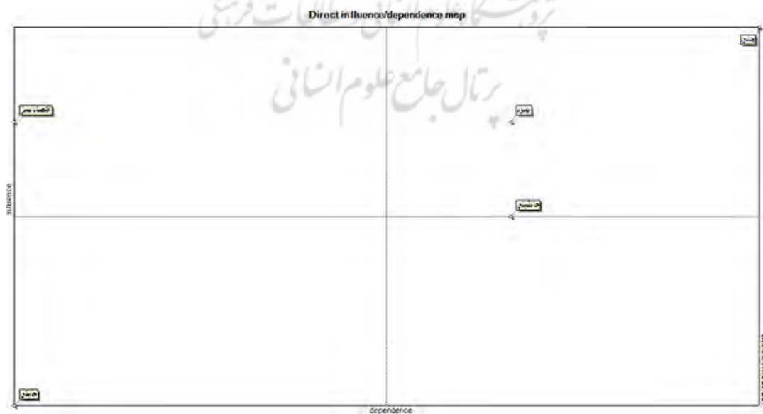
شکل ۱. نقشه اثر وابستگی مستقیم

از آنجا که در روش میک‌مک چهار نوع ماتریس تأثیرات مستقیم، تأثیرات غیر مستقیم، تأثیرات مستقیم بالقوه، تأثیرات غیر مستقیم بالقوه برای بررسی وجود دارند. اولین اقدام با شروع از ماتریس MDI انجام می‌گیرد. که فقط شامل روابط کنونی میان متغیرهاست و در برگیرنده متغیرهای ساختاری سیستم می‌باشد. نظرات خبرگان بصورت مستقیم در این جدول وارد می‌شود؛ و سپس ماتریس تأثیرات غیر مستقیم MII متناظر با ماتریس تأثیرات مستقیم است، که توسط نرم‌افزار با تکرار پی‌در پی تعداد چرخش‌ها تقویت شده است. دو ماتریس تأثیرات مستقیم بالقوه MPDI و تأثیرات غیر مستقیم بالقوه MPIO نیز با تخصیص یک مقدار متناظر به مقادیر تعریف شده در MDI به دست می‌آیند که شامل روابط کنونی و بالقوه و وابستگی بین متغیرها است (زالی و اژدری، ۱۳۹۵). در شکل ۱ زیر نقشه اثر وابستگی مستقیم آورده شده است.