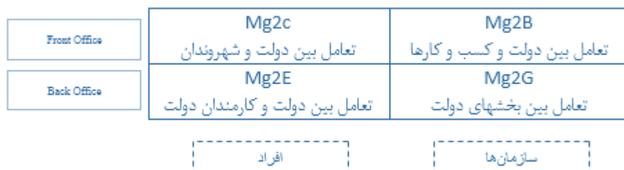
شکل ۱. مدل ارائه دولت همراه (زوکانگ و همکاران، ۲۰۱۱)