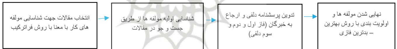
نمودار ۱- فرآیند کلی پژوهش

فرآیند کلی این پژوهش به شرح نمودار شماره ۱ می‌باشد: