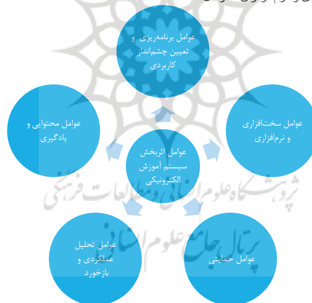
شکل ۲. عوامل اثربخش در اجرای سیستم آموزش الکترونیکی

در نتیجه عوامل اثربخش در بهبود اجرایی‌سازی سیستم آموزش الکترونیکی در پنج دسته شامل عوامل برنامه‌ریزی و تعیین چشم‌انداز کاربردی، عوامل سخت‌افزاری و نرم‌افزاری، عوامل