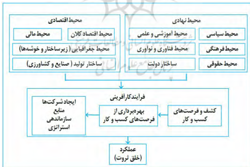
شکل ۲- مدل مفهومی کسب و کار بر اساس نظریه کارآفرینی شین ( Shane, 2003 )

یکی دیگر از مواردی که در تکمیل این دسته بندی می تواند مؤثر باشد، موضوع ارتقای فضای کسب و کار است. از نظر Boon, 2011 ، سیاست‌های نوآوری به دنبال ایجاد محیطی است که بازیگران مختلف حوزه عرضه و تقاضای نوآوری بتوانند در آن فعالیت کرده و به خروجی نهایی دست یابند. علاوه بر این Shane, 2003 فضای کسب و کار هر فعالیت اقتصادی و صنعتی را می توان به دو بخش اصلی محیط اقتصادی و محیط نهادی به شرح شکل ۲ طبقه بندی کرد. محیط اقتصادی شامل چهار بخش محیط اقتصاد کلان، محیط مالی، محیط جغرافیایی (زیرساختار و خوشه‌ها) و ساختار تولید است. محیط نهادی نیز از ۶ زیربخش محیط سیاسی، محیط فرهنگی، محیط حقوقی، محیط فناوری و نوآوری، محیط آموزشی و علمی، محیط حقوقی، ساختار دولتی و ساختار دولتی تشکیل شده است. مجموعه محیط‌های دو بخش اقتصادی و نهادی منجر به ایجاد فضای کسب و کار (مناسب یا نامناسب) برای یک فعالیت اقتصادی می‌شود. هر چه محیط کسب و کار (شامل محیط نهادی و اقتصادی) شرایط بهتری داشته باشد، بهره‌برداری از فرصت‌های کارآفرینی بیشتر است و متعاقباً هر چه بهره برداری از فرصت‌های کارآفرینی در جامعه ای بیشتر باشد، عملکرد اقتصاد آن کشور و خلق ارزش و ثروت در آن جامعه بیشتر می‌شود. از طرف دیگر یکی از کارکردهای اصلی که قوانین برنامه توسعه بر آن تمرکز داشته اند، علاوه بر بهبود مستمر فضای کسب و کار و تقویت ساختار رقابتی و رقابت‌پذیری بازارها (بند ۲ سیاست‌های کلی ابلاغی برنامه ششم)، ایجاد محیطی است که بازیگران مختلف بتوانند در آن به راحتی فعالیت کنند. این موضوع با مرور سیاست‌های کلی برنامه ششم و هفتم در حوزه توسعه فناوری و نوآوری به وضوح قابل مشاهده است.