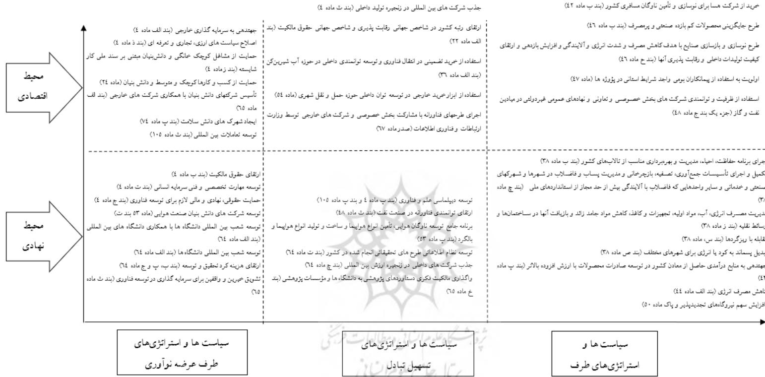
شکل ۴- تقسیم بندی احکام برنامه ششم توسعه در حوزه فناوری و نوآوری در چارچوب مفهومی پیشنهادی بر اساس یافته های جدول پیوست