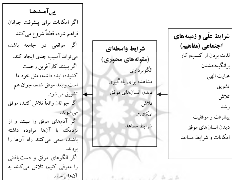
شکل ۲- مدل توسعه‌ی منابع انسانی کارآفرین، براساس نظریه‌ی یادگیری مشاهده‌ای «مدل شرایط علی، زمینه‌ای، واسطه‌ای و پی‌آمدها»

بشود، قطعاً شروع به حرکت می‌کنند؛ ولی اگر پیشرفت را ببینند و موانعی در جامعه باشد که عموم مردم نتوانند به سمت جلو حرکت کنند، این یک بغض ایجاد می‌کند و می‌تواند آسیب جدی ایجاد کند. اگر بیایند مطالعه کنند و ببینند در زندگی زحمت کشیده، ایده داشته، مثل خود ما است، یک آدم معمولی بوده و به این جا رسیده، جوان هم تشویق می‌شود. بعضی جوانان که واقعاً تلاش می‌کنند، موفق هستند.