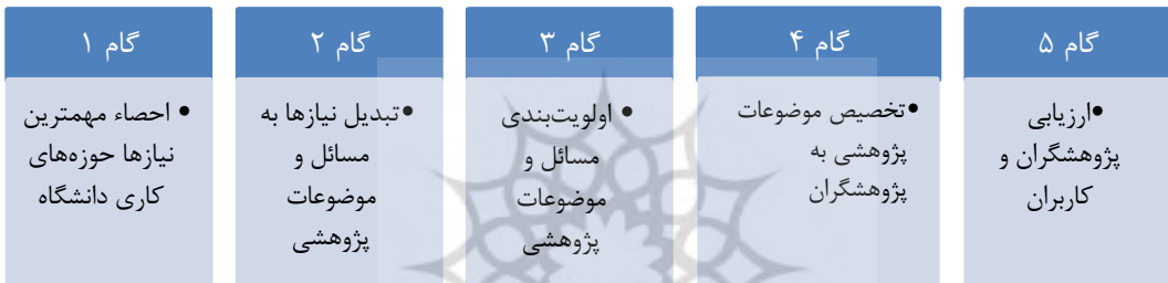
شکل ۱- گام‌های پیشنهادی مدل تحقیق

ادامه بیان می‌شود، مسائل پژوهشی و حوزه‌های تحقیقاتی تعریف‌شده را اولویت‌بندی می‌کند. کارگروه اولویت‌بندی بر اساس اسناد بالادستی (نقشه جامع علمی، منشور حرکت دانشگاه افسری امام علی (ع) در بیانیه گام دوم و ...) و نیازها و ظرفیت‌های دانشگاه، مسائل پژوهشی و حوزه‌ها را اولویت‌بندی خواهند کرد. در ادامه با انتشار اولویت‌ها در بین پژوهشگران و اخذ تولیدات پژوهشی، کارگروه اولویت‌بندی فعالیت‌های پژوهشی را بر اساس ارائه بهترین راه‌کارها و میزان تأمین نیاز کاربران خود (در صورتی که فعالیت پژوهشی در قالب طرح بوده باشد)، به صورت یک مدل علمی ارزیابی خواهد کرد. همچنین در صورتی که فعالیت به صورت طرح پژوهشی بوده باشد، کاربران نیز بر اساس میزان کاربردی، توسط کارگروه اولویت‌بندی (کمیته تخصصی تحقیقات معاونت پژوهش) ارزیابی خواهند شد. در ادامه، هر کدام از این گام‌های به صورت کامل تشریح می‌شود.