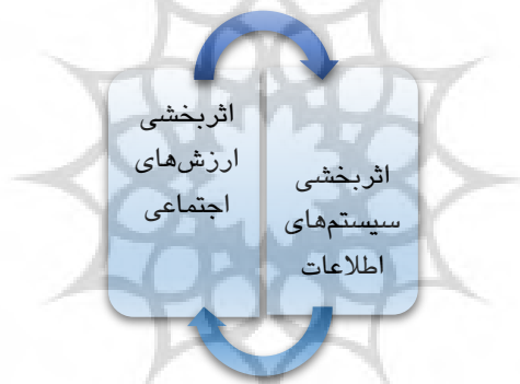
شکل ۱. شکل‌گیری مفهوم حسابداری سایه

است در ظاهر سیستم‌های مالی و عملکردی با سیستم‌های اقتصادی که مبتنی بر منفعت بیشتر نسبت به هزینه‌ها هستند، مطابقت نداشته باشد، اما جریان آزاد اطلاعات، مبنایی برای ایجاد پیوند بین سیستم‌های حسابداری با سایر سیستم‌های اجتماعی به تدریج خواهد شد (امیر آزاد و همکاران، ۱۳۹۷: ۲۴). حسابداری در طی سال‌های اخیر بر اساس مفاهیم همچون حسابداری هنجاری ۱ (کبیر ۲ ، ۲۰۰۵)؛ حسابداری متقابل ۳ (بویسی ۴ ، ۲۰۱۵)؛ حسابداری ضد اجتماعی ۵ (اسپنس ۶ ، ۲۰۰۹) حسابداری حقوق ذینفعان (روردیگوئر ۷ ، ۲۰۱۵) به دنبال توسعه ارزش‌های اجتماعی در کارکردهای این حرفه بوده است. تحت جنبش اجتماعی در دانش حسابداری، حسابداری سایه که مفهوم فراگیر و مبتنی بر حوزه‌های اخلاقی؛ اجتماعی؛ زیست‌محیطی و حتی فرهنگی می‌باشد، از پیوند دانش حسابداری با عرصه‌های علوم اجتماعی و ساختاری حادث گردید (زارعی و همکاران ۸ ، ۲۰۲۱: ۲۴۱). در واقع این اصطلاح برای نشان دادن طیفی از ارزش‌ها و هنجارهای اجتماعی است که تحت تأثیر انتظارات و تغییرات جوامع؛ گویایی سطحی از مسئولیت اخلاقی و پایداری متعهدانه حسابداری به بسترهای اجتماعی می‌باشد (شاهولی زاده و همکاران، ۱۴۰۱: ۴۱) که می‌تواند به واسطه اثربخشی سیستم‌های اطلاعاتی به ذینفعان در قالب شکل (۱) منعکس گردد.