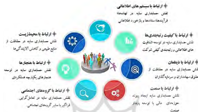
شکل ۲. پیوندهای ناشی از حسابداری سایه (منبع: دی و همکاران، ۲۰۱۱)

علاوه بر این، دای ۱ (۲۰۰۹) حسابداری سایه را به عنوان یک سیستم اطلاعات مدیریت تلقی می کند که انتظارات و تغییرات برآمده از نیازهای اجتماعی، را در سیستم نهادینه می کند و از طریق شیوه های تصمیم گیری استراتژیک، عرصه های اجتماعی مورد مناقشه با عملکردهای شرکت ها را بهبود می بخشد. به علاوه دی و همکاران ۲ (۲۰۱۱) حسابداری سایه را به ۷ پیوند تفکیک می کنند که در قالب شکل (۲) می توان این پیوندها را مشاهده نمود.