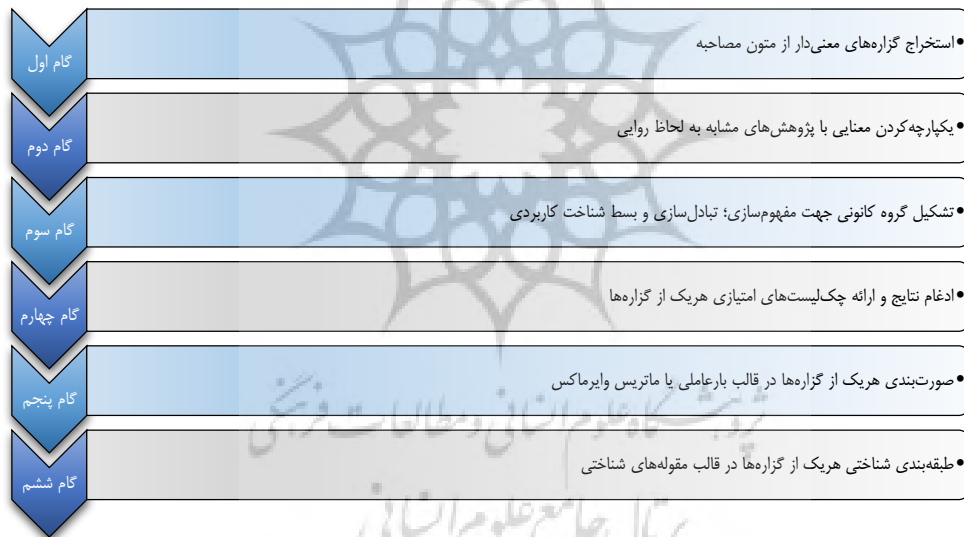
شکل ۴. مراحل پیاده‌سازی اقدام پژوهی (منبع: کلازی، ۱۹۸۷)

لازم است تا پرسشنامه‌های امتیازبندی شده‌ای ایجاد شود تا از طریق تکنیک وایرماکس، مشخص گردد، تجربه و دانش گروه کانونی، هر گزاره را در کدام دسته جایگذاری می‌کند. تشکیل جلسات گروه کانونی، طی سه مرحله مفهوم‌سازی، تبادل‌سازی و شناخت‌سازی محتوایی صورت می‌گیرد تا امکان اختصاص امتیاز هر یک از مشارکت‌کنندگان به گزاره‌ها برای طبقه‌بندی مفهوم حسابداری سایه ایجاد شود. بنابراین این مطالعه به لحاظ نتیجه، توسعه‌ای تلقی می‌شود و به لحاظ هدف بر اساس ماهیت انجام مصاحبه جهت شناسایی گزاره‌های نوظهور حسابداری سایه، اکتشافی است. از نظر ترکیبی بودن ماهیت جمع‌آوری داده‌ها نیز همان‌طور که مطرح گردید، این مطالعه ترکیبی محسوب می‌شود به‌طوری‌که در بخش کیفی جهت مفهوم‌سازی پدیده مورد بررسی از مصاحبه با خبرگان نسبت به جمع‌آوری داده‌ها اقدام می‌شود و در بخش کمی از طریق داده‌های امتیازی پرسشنامه کیو و تحلیل وایرماکس، مشخص می‌گردد گزاره‌ها در کدام دسته طبقه‌بندی می‌شوند. به‌منظور فرآیند پیاده‌سازی مطالعه حاضر، طبق شکل (۴)، مراحل اجرای تحلیل مطابق با الگوی کلازی (۱۹۷۸) توضیح داده می‌شود.