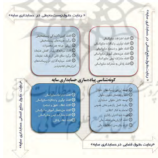
شکل ۷. طبقه‌بندی شناختی حسابداری سایه در بستر شرکت‌های بازار سرمایه

هدف این پژوهش اقدام پژوهی حسابداری سایه به‌منظور گونه‌شناسی رعایت ارزش‌های اجتماعی شرکت‌های بازار سرمایه بود. همان‌طور که طی فرآیند انجام پژوهش مشخص شد، ابتدا از طریق مصاحبه و فرآیند کدگذاری باز، شناسایی گزاره‌های حسابداری سایه صورت پذیرفت. سپس باهدف دستیابی به روایی، تطبیق بین پژوهش‌های مشابه صورت گرفت تا امکان ورود گزاره‌های شناسایی شده در الگوی تحلیل کیو برای طبقه‌بندی شناختی پدیده در بستر شرکت‌های بازار سرمایه مهیا شود. در ادامه با تشکیل گروه کانونی جهت تعیین طبقه‌های شناختی مفهوم موردبررسی، طی چهار جلسه و با ایجاد یک چک‌لیست ارزیابی کیو از +۵ تا -۵ طی ۲۶ خانه متناسب با گزاره‌های شناسایی شده اقدام لازم صورت گرفت و با درک مسئله از آنان خواسته شد تا نسبت به قرار دادن هر گزاره در یکی از ۲۶ خانه چک‌لیست ارزیابی کیو اقدام نمایند. سپس از طریق ماتریس وایرماکس نسبت به تعیین طبقه‌های شناختی در خصوص تفکیک گزاره‌های حسابداری سایه اقدام شد و نتایج از وجود ۴ طبقه شناختی در خصوص بستر سازی حسابداری سایه در سطح شرکت‌های بازار سرمایه حکایت داشت. لذا طبق یافته‌های ارزیابی، می‌توان ماتریس حسابداری سایه را در قالب شکل (۷) ارائه نمود.