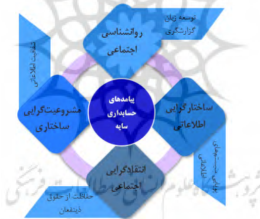
شکل ۳. پیامدهای حسابداری سایه

از طرف دیگر، اسپنس (۲۰۰۹) حسابداری سایه را نوعی توسعه منش مدنی/ اجتماعی در افشاء اطلاعات تعریف می‌کند که می‌تواند در مهندسی مجدد این دانش در مواجهه با تغییرات مهم در محیط اجتماعی جوامع مؤثر باشد. اسپنس (۲۰۰۹) در ادامه چشم‌اندازهای پیامدی حسابداری سایه را در قالب شکل (۳) ارائه می‌دهد.