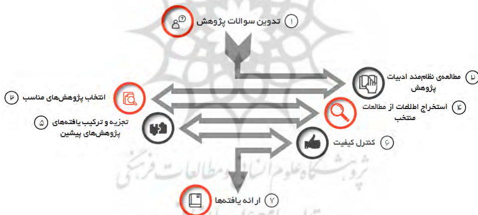
نمودار ۱. گام‌های اجرایی روش فرا ترکیب

می‌گیرد (کوهن ۱ ، ۱۹۶۲)، بلکه می‌تواند از یک ادغام عقب‌گرا از شواهد قبلی نیز پدید آید (کمپبل ۲ ، ۱۹۷۴؛ ویک ۳ ، ۱۹۸۹). فعالیت‌های سنتز پژوهشی از آنجایی که این درک از ترکیب تحقیق به‌عنوان تجمیع، تفسیر و ترجمه مبتنی بر مفروضات متفاوتی است، راه‌های متمایزی برای نزدیک شدن به ترکیب دانش ایجاد می‌کنند (روسو و همکاران ۴ ، ۲۰۰۸). فرا ترکیب به‌عنوان یک طرح تحقیقاتی اکتشافی و استقرایی برای ترکیب مطالعات موردی اولیه به‌منظور ایجاد مشارکتی فراتر از آنچه در مطالعات اولیه بدست آمده است، تعریف می‌شود. این روش یکی از شیوه‌های پژوهش فرامطالعه است که شامل انباشت شواهد کیفی مطالعات قبلی و به‌طور خاص استخراج، تجزیه و تحلیل و ترکیب آن‌ها می‌شود. در نتیجه، یک فرا ترکیب اقدام به استفاده مجدد از داده‌های دست اول ناشی از مشاهدات یا مصاحبه‌های خود محققین مورد اشاره، نمی‌کند. در عوض، یک فرا ترکیب در سطحی اتفاق می‌افتد که محققان اصلی مطالعات اولیه، پیش‌های خود را مطابق با درک و تفسیر خود از داده‌ها ساخته‌اند (ترانفیلد ۵ و همکاران ۶ ، ۲۰۰۳؛ سندلوفسکی و باروسو ۶ ، ۲۰۰۷). بنابراین در این پژوهش فرا ترکیب، یک بررسی سیستماتیک کیفی با الهام از رویکرد معرفی شده توسط سندلوفسکی و باروسو (۲۰۰۷) دنبال شد (نمودار ۱ را ببینید).