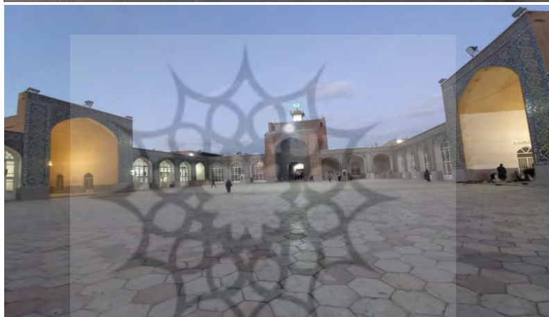
شکل ۲: حیاط و ایوان و معماری اسلامی در میدان گنج علی خانه کرمان (راست) مسجد جامع کرمان (چپ) (نگارنده)

نور: نور و رنگ دو عامل القاء حس آرامش و مؤثر در دریافت حس معنویت در انسان می باشد؛ همان طور که نور باعث روشنایی دنیای بیرون می شود، به همان گونه هم روشنی بخش دنیای درون انسان است. به دیگر سخن، نور هم معمار درون است و هم معمار بیرون (مهدی نژاد و همکاران، ۱۴۰۲، ص ۱۶۲). نور جلوه خداوند است که حضورش در معماری اسلامی به ویژه در مسجد که خانه اوست تجلی می یابد. «الله نور السموات و الارض» و در کاستن از صعوبت و سختی و سردی سنگ و بنا نقش بسزایی دارد. تجلی متافیزیک نور بر فیزیک بنا، آن را اصلی ترین محور زیبایی شناسی معماری اسلامی در عرفان و معنا قرار داده است. در بناها از کف براق، و درخشنده و سطوح دیوارها برای شکار نور استفاده می شد و گاهی نور طوری از سقف های الماسی شکل باز می تابید که انعکاسی در پی داشت.