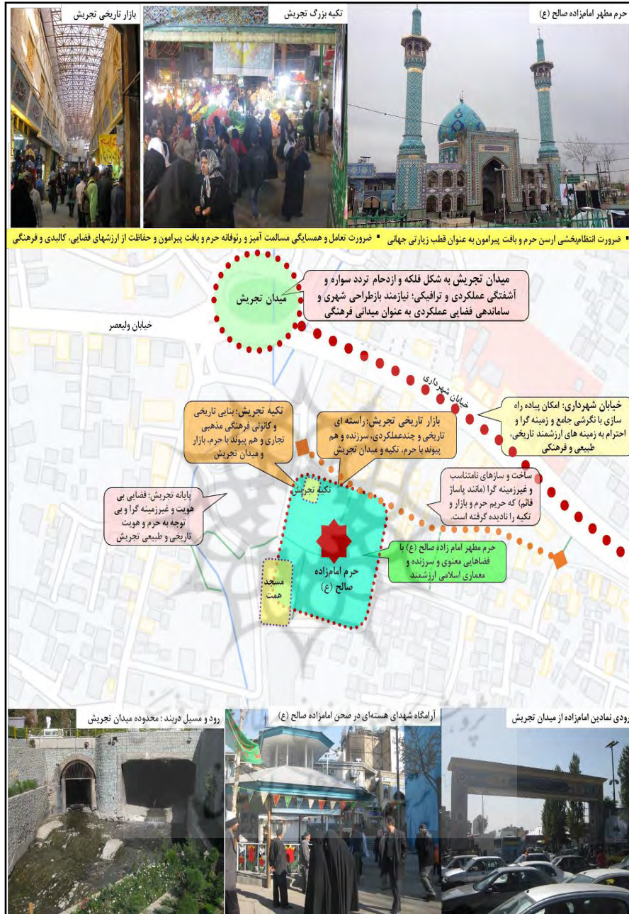
شکل ۳: معماری و شهرسازی اسلامی در مجموعه میدان تجریش و امامزاده صالح و تیکه تجریش