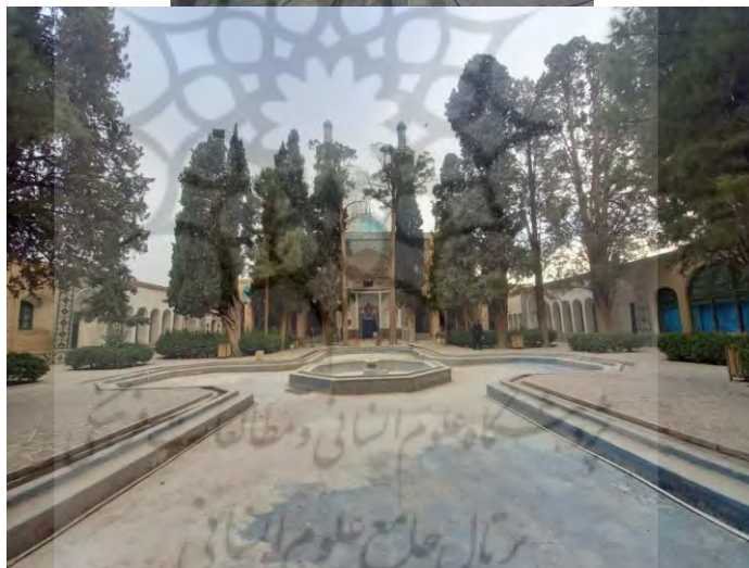
شکل ۴: حضور طبیعت و معماری اسلامی در مجموعه آرامگاه شاه نعمت‌الله ولی در ماهان کرمان