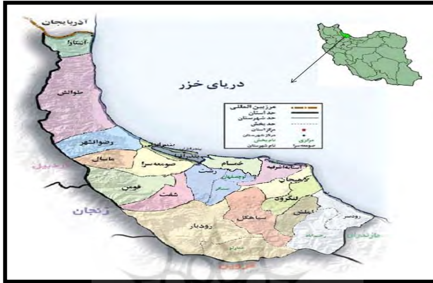
شکل ۱. موقعیت جغرافیایی استان گیلان

غفاری و همکاران (۱۴۰۰) در پژوهشی با عنوان «طراحی مدلی جهت بسط مفهومی کوچینگ عملکرد کارکنان در سازمان‌های دولتی ایران» به این نتیجه دست یافتند که به کارگیری تکنیک مربیگری در مدارس مزایایی از قبیل بالا رفتن اثربخشی آموزش‌ها، بهبود تعاملات و ارتباطات سازمانی، پرشدن شکاف میان حوزه نظر و عمل آموزش‌های سازمانی، کاهش هزینه‌های آموزشی و تبدیل سازمان به سازمانی پویا را به ارمغان می‌آورد.