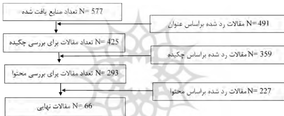
شکل ۲. چارچوب انتخاب مقالات نهایی

گام سوم: جستجو و انتخاب متون مناسب. در فرآیند جستجو، عواملی مانند موضوع، چکیده، محتوا و جزئیات مقاله (نام نویسنده، سال) در نظر گرفته شدند و مقالاتی که با سوال و هدف پژوهش تناسبی نداشتند حذف شدند. شکل ۲، چارچوب انتخاب مقالات نهایی راهبردهای تاب‌آوری زنجیره تامین را نشان می‌دهد.