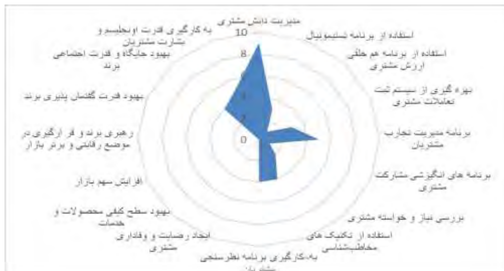
نمودار ۰۱. وزن نهایی عوامل