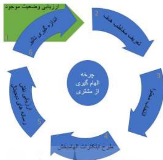
شکل ۱. چرخه الهام‌گیری از مشتری (Böttger et al, 2015)

را کاهش دهد. مدیران بازاریابی باید از این اثرات غیر مستقیم الهام‌گیری از مشتری آگاه باشند تا بتوانند ابتکارات خود را بهینه کنند (Böttger et al, 2015).