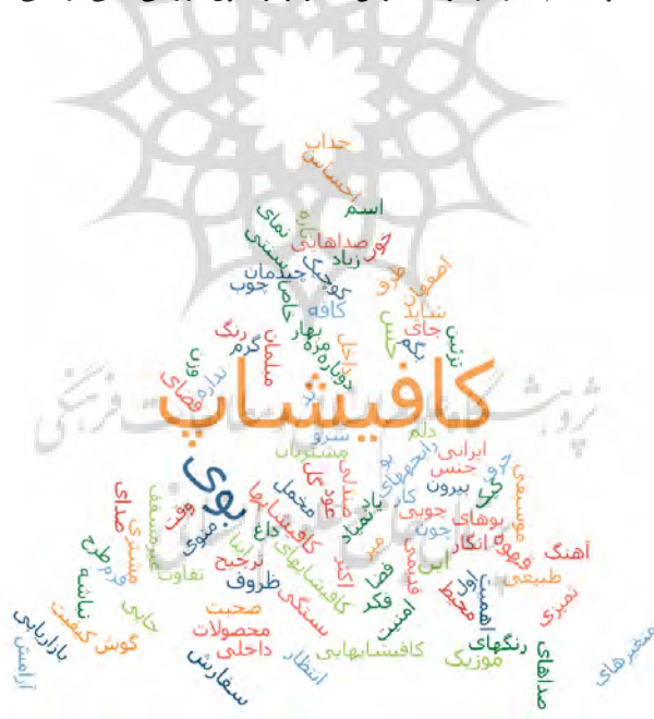
شکل ۲- ابزار ورد کلود نرم‌افزار مکس کیودا