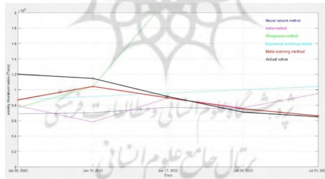
شکل ۳: نمودار مقایسه پیش‌بینی سری زمانی در ۵ مقطع آینده مدل‌های مختلف پیش‌بینی با داده‌های واقعی

باتوجه به نتایج به‌دست آمده روش یادگیری متای استفاده‌شده در مقایسه با دیگر روش‌های پایه‌ای، عملکردی به‌طور کامل، برتر داشته است. باتوجه به اطلاعات جدول ۱ می‌توان عملکرد روش‌های پایه‌ای را نیز با یکدیگر مقایسه کرد. با انجام دادن این مقایسه مشاهده می‌شود که روش شبکه عصبی نسبت به دیگر روش‌ها برتری دارد. با مقایسه روش‌های پیش‌بینی گفتنی است که روش رگرسیون ساده به‌گونه‌ای