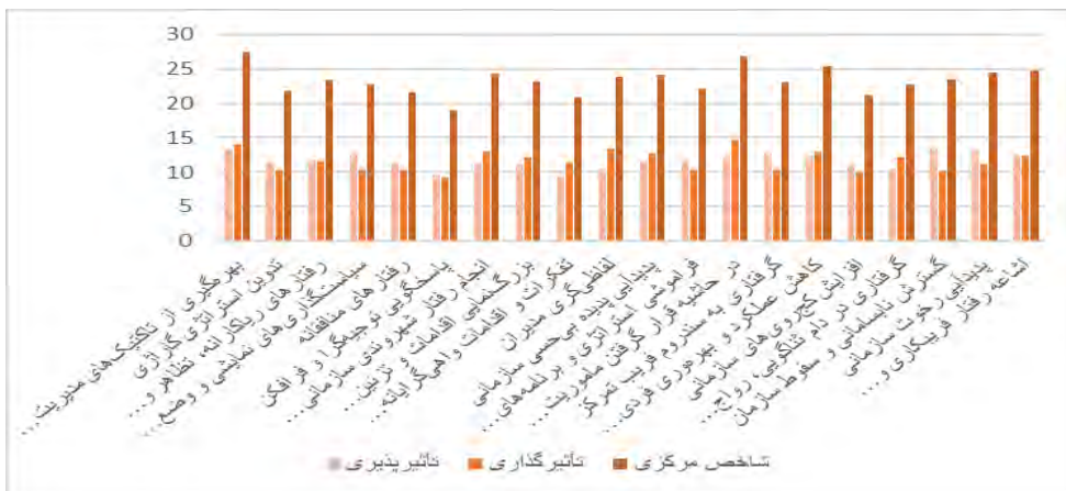
نمودار ۱. ظرفیت تأثیرپذیری، توان تأثیرگذاری و شاخص مرکزی

پس از اینکه شاخص‌ها به دست آمدند، داده‌ها به نرم‌افزار Gephi منتقل شدند و در نهایت مدل نهایی (مدل روابط علی) ترسیم شد.