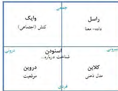
شکل شماره ۳: نظریات معنابخشی (Jones, 2015; Snowden, 2021a)

همان‌طور که در شکل ۳ ملاحظه می‌شود، مکاتب معنابخشی را می‌توان با استفاده از دو مرجع بازنمایی درونی-بیرونی معنا و تفسیر فردی یا جمعی از آن در چهار ناحیه دسته‌بندی نمود: به بیان دیگر، برخی از نظریات، محل و موضع معنابخشی را درونی و برخی آن را بیرونی می‌دانند، علاوه بر این برخی معتقدند معنابخشی به صورت فردی اتفاق می‌افتد و برخی نیز آن را یک فعالیت جمعی در نظر می‌گیرند. در این میان تمرکز وایک برکنش سازمانی (جمعی) بوده است و موقعیت معنابخشی به‌عنوان نماینده معنای جمعی درونی شده است. دروین رویکرد فردی و هرمنوتیکی روشنی نسبت به موقعیت فرد و تجربه‌ذهنی درونی آن‌ها از معنابخشی دارد. تمرکز کلاین مدل ذهنی فردی (چارچوب‌ها ۱ ) است که در بافتار یا فعالیت خارجی اعمال می‌شود (نحوه نمایش داده‌های خارجی). معنابخشی وی، فرایندی دوطرفه است که در آن داده در قامت چارچوب ذهنی و چارچوب ذهنی در قامت داده ظاهر شده و هیچ‌کدام بر دیگری ارجح نیست. دیدگاه نظری اطلاعات راسل که آغازگری بر طراحی سیستم‌های تعاملی معنابخشی بود، معنابخشی را به‌عنوان موقعیت جمعی (جهان اطلاعات) تا حد زیادی در خدمت تفسیر داده‌های بیرونی قرار می‌دهد. در نهایت مدل تکاملی اسنودن، معنابخشی را یک فعالیت تولید دانش، با استفاده از داده‌ها برای درک مشترک از حوزه‌های مسئله ۲ (درک به‌مثابه واحد تحلیل ۴ ) در نظر می‌گیرد (Snowden, 2021a).