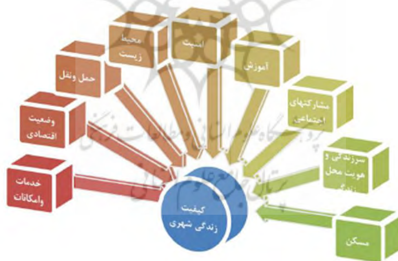
نمودار 1. متغیرهای وابسته کیفیت زندگی در این تحقیق

همان‌طور که موضوع و هدف پژوهش نشان می‌دهد مؤلفه‌های کیفیت زندگی به عنوان متغیرهای وابسته در این تحقیق مورد بررسی و تحلیل قرار گرفته‌اند.