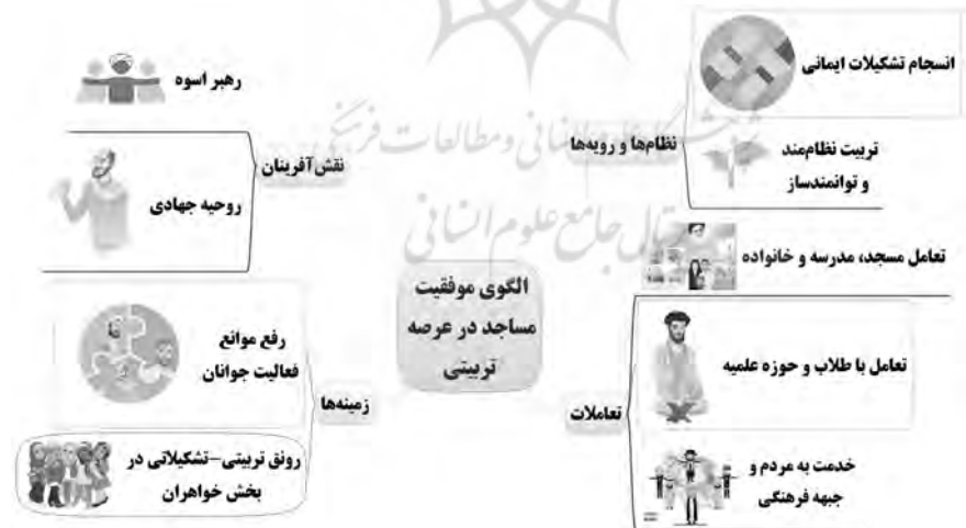
شکل ۳. الگوی موفقیت مساجد در عرصه تربیتی

در ادامه، مؤلفه‌های اصلی الگوی موفقیت مساجد در عرصه تربیتی ذکر می‌شوند.