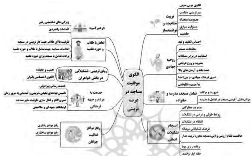
شکل ۲. شبکه مضامین الگوی موفقیت مساجد در عرصه تربیتی

در مرحله تجزیه و تحلیل داده‌ها از متن مصاحبه‌ها و اسناد ۴۴۰ مضمون اولیه، ۴۲ مضمون پایه، یازده مضمون سازمان‌دهنده و چهار مضمون فراگیر استخراج شد. مضامین استخراج‌شده از مصاحبه‌ها و شبکه مضامین در ادامه ارائه شده است.