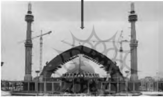
تصویر ۱. نمونه به کارگیری علم الحروف در معماری مساجد

مورد دوم در باب به کارگیری علم الحروف در طراحی فضای قدسی «گنبد و گلدسته» همه مساجد است. توضیح آن که بر اساس حروف ابجد، برخی از آیات قرآن کریم، دارای ضرب آهنگ‌های خاصی هستند که ترجمان کالبدی آن‌ها را می‌توان در معماری اسلامی مشاهده نمود. یکی از این موارد عبارت کاملاً متقارن «رَبِّکَ بَکْبَر: پروردگارت را بزرگ بدار» (مدثر، ۳) است که اگر بر اساس ارزش عددی حروف ابجدش در نظر گرفته شود و این اعداد تبدیل به یک نمودار گرافیکی شود، شکلی که حاصل می‌شود، تداعی کننده شکل گنبد و گلدسته‌های طرفینش است؛ اما موضوع آنگاه جالب‌تر می‌شود که به معنای آیه نیز توجه کنیم: «پروردگارت را بزرگ بدار»؛ معنایی که دقیقاً متناسب با معنای ترفیع گنبد و گلدسته است (رئیس، ۱۴۰۲: ۹۸). تکبیر و بزرگداشت حضرت حق، معنای باطنی‌ای است که از مسیر سازه گنبد و گلدسته، ولو به صورت ناخودآگاه به ضمیر مخاطب القا می‌شود.