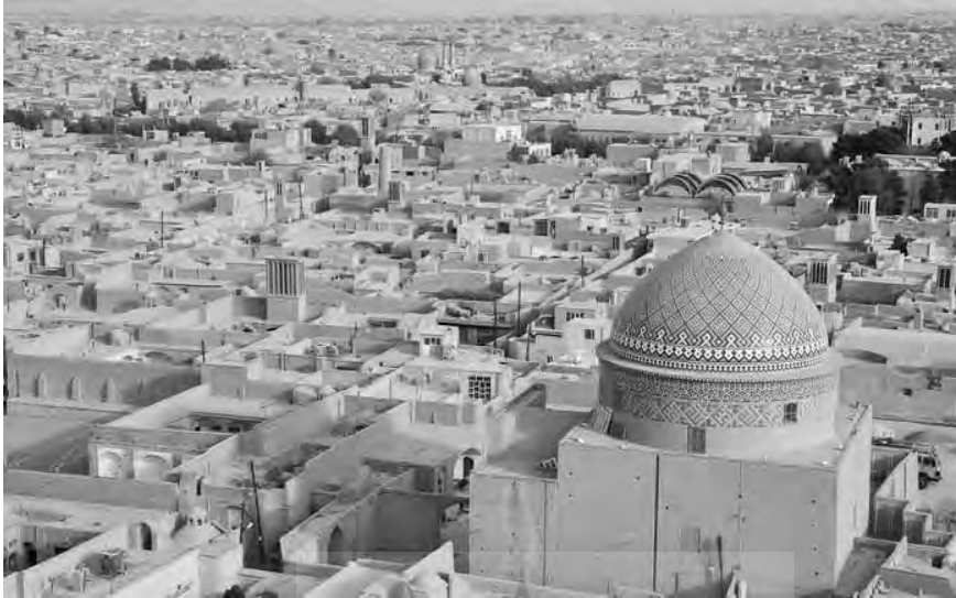
تصویر ۲. نمونه‌ای از تواضع معماری شهر در فرم، رنگ و ارتفاع در قبال مسجد (بافت قدیم شهر یزد)