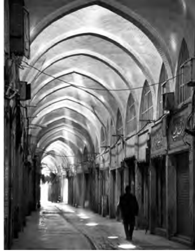
«سردر و ورودی بازار قیصریه اصفهان، با تنوعی از عناصر معماری قدسی اعم از آب (حوض)، طاق، مقرنس، کاشی کاری با نقوش اسلامی و...»