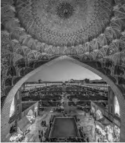
«بازار قدیم تهران، با عناصر معماری قدسی هورنو و طاق»