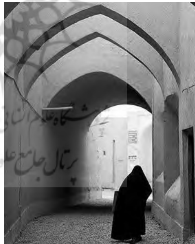
«نمایی از گذر و معبر شهری با طاق قوسی»

تصویر ۳: نمونه‌هایی از بازتولید عناصر تزئینی و معماری قدسی مسجد در سایر ابنیه شهری