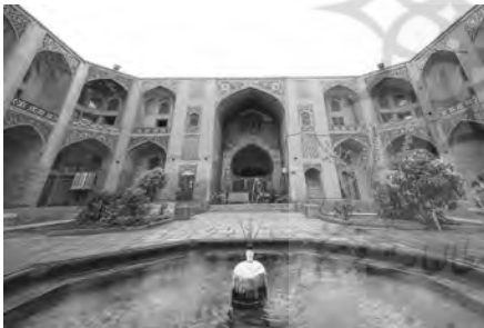
«کاروان سرای گنجعلی خان کرمان، با تنوعی از عناصر معماری قدسی اعم از آب (حوض)، طاق قوسی، مقرنس، کاشی کاری با نقوش اسلامی و...»