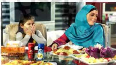
شکل (۱): آگهی تبلیغات ماکارونی تبرک