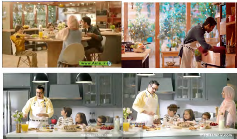
شکل (۶): نمونه‌هایی دیگر از حضور مردان در آگهی‌های بازرگانی داخلی (مربا و رُب چین چین)