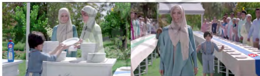
شکل (۲): آگهی تبلیغاتی مایع ظرفشویی پرل