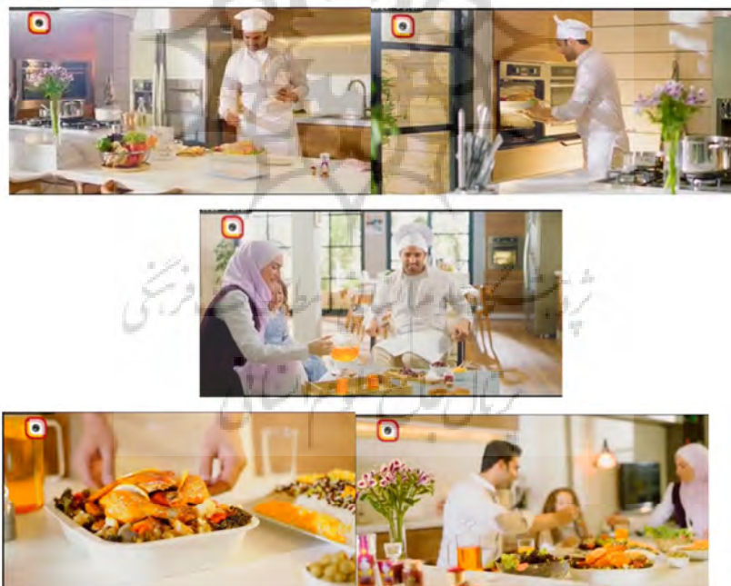
شکل (۴): آگهی تبلیغاتی زعفران گوهر ناز

خانواده شاد و آرام خانواده‌ای است که مرد تا حد زیادی کارهای منزل را انجام دهد و یک فرزند دارند. در تبلیغ‌های جدید نیز به‌ندرت مهمانی خانوادگی یا حتی دوستانه به تصویر کشیده می‌شود. تک‌فرزندی، انفعال زن خصوصاً در امور منزل همچنین انزوای خانواده هسته‌ای حکایت از تقابل با ایدئولوژی مسلط دارد.