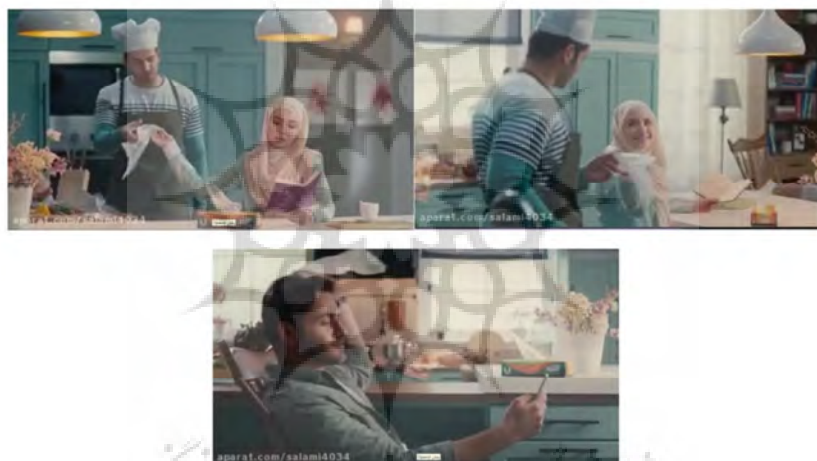
شکل (۳): آگهی تبلیغاتی کیسه پلاستیک آیری پلاست

خانواده ایدئال خانواده‌ای متشکل از یک زن و مرد است؛ که فعلاً فرزندی ندارند و یا قصد فرزند دار شدن ندارند. مرد برخی از کارهای منزل را انجام می‌دهد و مشارکت فعال دارد. زن اهل مطالعه و تحصیل کرده است و در آشپزخانه محصور نیست. این تبلیغ نیز حکایت از تقابل با ایدئولوژی مسلط دارد.