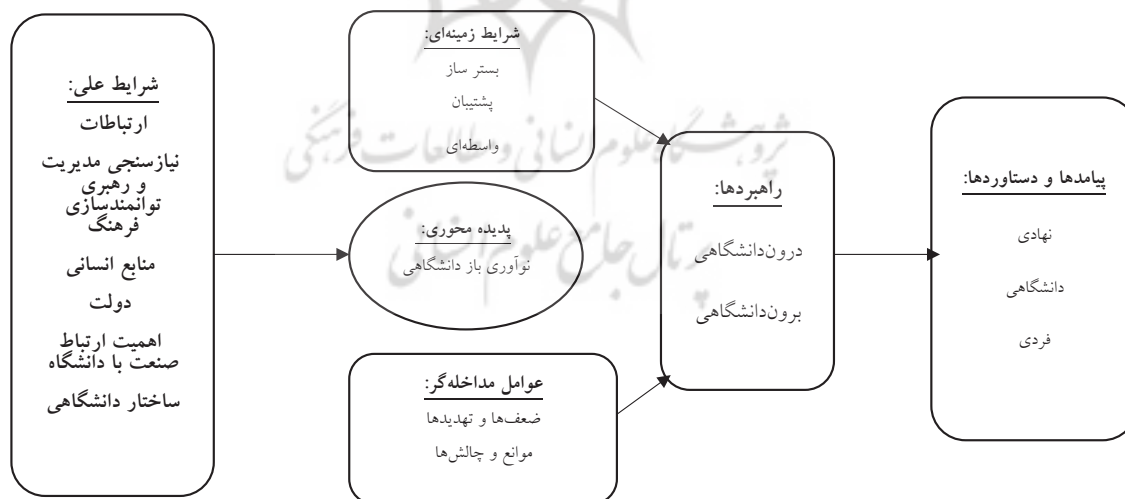
شکل (۳) مدل پارادایمی دانشگاه باز

پیامدها و دستاوردها در نوآوری باز دانشگاهی، در سه سطح نهادی، دانشگاهی، فردی است: دستاوردها در سطح نهادی، کسب سهم بیشتر در بازار توسط دانشگاه نوآور باز، استفاده از توانمندی های شرکت های دانش بنیان و زایشی، هوشمندی محیطی، فناوری و توسعه تجاری سازی، تأثیر مستقیم و غیر مستقیم درآمدزایی و ارزش افزوده بر اقتصاد کشور، قرارگرفتن دانشگاه های نوآور باز در رتبه های جهانی؛ در سطح دانشگاهی، ثروت آفرینی و ارزش آفرینی، ایجاد محصولات باکیفیت، ارتقای ظرفیت دانشی دانشگاه با خلق دانش جدید، حمایت از سرمایه فکری، ثبت اختراع، پتنت، توسعه دانشگاهی، ارتقای کیفیت دانشگاه ها، درآمدزایی و سوددهی؛ در سطح فردی، اشتراک گذاری ریسک به عنوان عامل انگیزشی، ارتقای درک دانشجویان از کارآفرینان احتمالی خود در آینده، تربیت دانشجویان نقاد و ایده پرداز است. پدیده محوری در این پژوهش نوآوری باز دانشگاهی است که بر اساس هشت کد باز معرفی شده است. براساس یافته های پژوهش، مقوله محوری یا پدیده مورد نظر «نوآوری باز دانشگاهی» است. این پدیده محوری به وسیله شرایط علی (ارتباطات، نیاز سنجی، مدیریت و رهبری، توانمندسازی، فرهنگ، منابع انسانی، دولت، ارتباط صنعت با دانشگاه) را تحت شرایط عوامل زمینه ای (بستر ساز، پشتیبان، واسطه ای) می توان معرفی کرد که عوامل مداخله گر آن (موانع و چالش ها و تهدیدها) است. راهبردها به دو بخش درون دانشگاهی و برون دانشگاهی؛ پیامدها و دستاوردها در سه سطح نهادی، دانشگاهی و فردی معرفی شده اند. مدل پارادایمی استخراج شده به صورت ذیل ترسیم شده است.