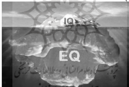
شکل (1) رابطه IQ و EQ

روانی، کنترل تکانه‌ها و عاملی است که هنگام شکست ناشی از دست نیافتن به هدف، در شخص انگیزه و امید ایجاد می‌کند. این نوع هوش، همچنین حاکی از همدلی، یعنی آگاهی یافتن از احساسات افراد پیرامون ما است. امروزه، هوش عاطفی به طور فزاینده‌ای تبدیل به یک عامل اندازه‌گیری نیروی انسانی اثربخش شده است. نتایج حاصل از بررسی‌های صورت گرفته، حکایت از نقش قابل ملاحظه هوش عاطفی در زندگی و به خصوص در سازمان‌ها دارد، تا حدی که برخی پژوهشگران نقش هوش عاطفی را تا 80% و نقش هوش منطقی را تنها 20% می‌دانند. تحقیقات نشان می‌دهد که متخصصی که از EQ 1 یا ضریب عاطفی بالایی برخوردار و از نظر فنی نیز با تجربه است، با آمادگی و مهارت بیشتر و سریع‌تر از دیگران به رفع تعارض‌های نوپا، ضعف‌های گروهی و سازمانی و خلأهای موجود خواهد پرداخت. علوم جدید ثابت کرده‌اند که زیربنای بسیاری از تصمیمات مهم، فعال‌ترین و سودمندترین سازمان‌ها و رضایت بخش‌ترین و موفق‌ترین زندگی‌ها، شعور عاطفی است نه IQ 2 یا قدرت مغزی (قمرانی، 1383).