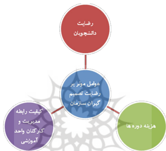
نمودار (۲) عوامل مؤثر بر رضایت تصمیم‌گیران سازمانی

رضایت تصمیم‌گیران سازمانی نیز به سه شاخص کلی رضایت دانشجویان، هزینه دوره‌ها و کیفیت رابطه مدیریت و کارکنان واحد آموزشی تقسیم شده است. از آنجا که رضایت کلی دانشجویان در مدل قبلی مورد بررسی قرار می‌گیرد؛ شاخص‌های جزئی رضایت در این مدل آورده نشده است. عوامل مؤثر بر رضایت تصمیم‌گیران سازمانی از خدمات مراکز آموزش شغلی مدیریت نیز در نمودار (۲) نشان داده شده است: