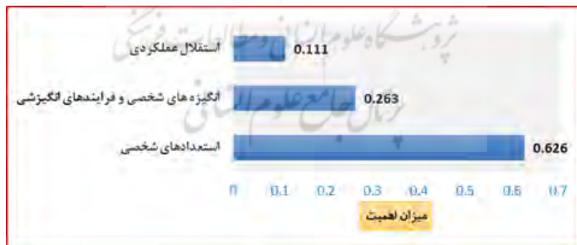
شکل ۲. نتایج رتبه بندی عوامل درونی

یافته ها در شکل فوق نشان می دهد که در بعد عوامل درونی، مولفه «استعداد شخصی» با ضریب ۰/۶۲۶ در رتبه اول قرار دارد. مولفه «انگیزه های شخصی و فرایندهای انگیزشی» با ضریب ۰/۲۶۳ در رتبه دوم و مولفه «استقلال عملکردی» با ضریب ۰/۱۱۱ در رتبه سوم قرار گرفته است.