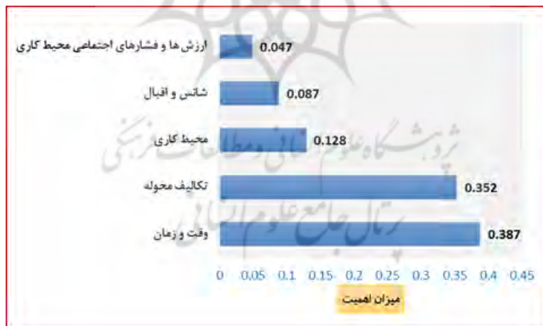
شکل ۳. نتایج رتبه بندی عوامل بیرونی

نرخ ناسازگاری مقایسات در جدول کمتر از ۰/۰۳ بدست آمده است با توجه به اینکه نرخ ناسازگاری مقایسات کمتر از ۰/۱ است می توان از مقایسات برای رتبه بندی عوامل بیرونی استفاده کرد. مطابق با جدول بالا رتبه بندی معیارها بصورت زیر است. رتبه بندی عوامل بیرونی در نمودار میله ای زیر آمده است: