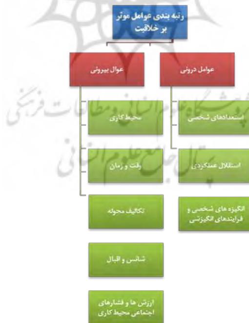
شکل ۱. ساختار سلسله مراتبی مسئله در روش AHP

در روش AHP مقایسه زوجی بین هر کدام از سطوح معیارها انجام می‌گیرد و به کمک نرم افزار Expert choice پر سشنامه‌های مقایسه زوجی تحلیل و نرخ ناسازگاری آنها تعیین می‌شود. چنانچه نرخ سازگاری کمتر از ۰/۱ باشد مقایسه‌های زوجی انجام گرفته شده، قابل قبول می‌باشد. در جداول مقایسات زوجی چنانچه معیارهای سطر بر معیارهای ستون ارجحیت داشته باشد با رنگ مشکی و چنانچه ستون بر سطر ارجحیت داشته باشد اعداد با رنگ قرمز نشان داده شده است.